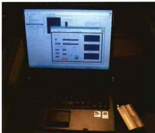
Vista de un sistema de control remoto en PC portátil usando módem GPRS.

red, que puede ser privada (VPN-Virtual Private Network o red privada virtual). Podremos acceder a conocer su estado con un simple navegador web (Internet Explorer, Netscape Navigator, Konkeror) que puede estar en un PC de sobremesa, portátil o incluso una PDA con la única condición de que también esté conectada a la misma VPN a través de