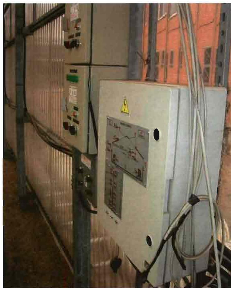
Los paneles de control tradicional pueden comunicarse y complementarse con un control remoto via GPRS.

GPRS. Podemos conocer en tiempo real el contenido de un depósito de agua alejado decenas de kilómetros, la presión de las tuberías de riego, la cantidad de grano en un silo, o la temperatura, humedad e iluminación de un invernadero, y todo ello por un coste similar al de una llamada de teléfono móvil.