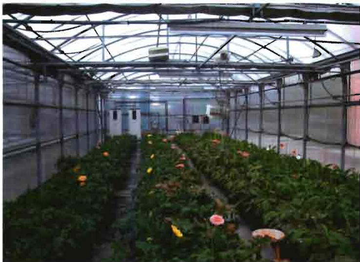
Vista general de cultivo bajo invernadero con control remoto vía telefonía móvil.