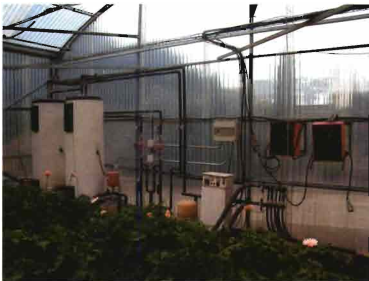
El control remoto puede ser aplicado, entre otros, a los sistemas de calefacción del invernadero.

sados en la transmisión por GSM unos equipos a tener muy en cuenta a la hora de plantear un sistema de telemando o telemonitorización.