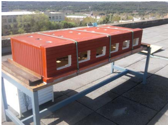
Fig. 2: Modelo a escala (1/ 12 ) del aula 2G5 de la ETSAM

Para ello se han utilizado 26 sensores de iluminación (fotómetros) Li210, 13 colocados en el aula y 13 en el modelo, que se encuentra dos plantas por encima del aula y con la misma orientación, dispuestos en los lugares más significativos tal y como se muestra en la Fig. 3.