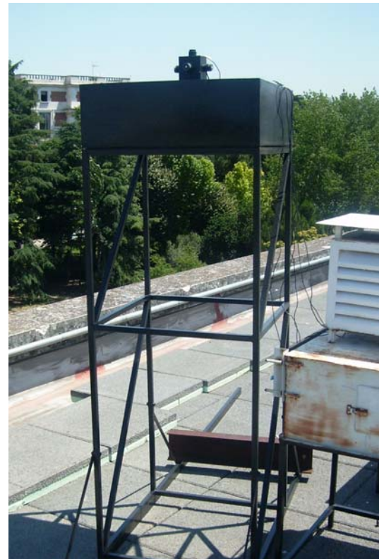
Fig. 4: Torre de medida de iluminancias cenital y verticales

Además de lo comentado anteriormente, en la estación también se están midiendo iluminancias en superficies inclinadas. Para ello se dispone de una superficie semiesférica de metacrilato transparente (domo) con 145 agujeros,