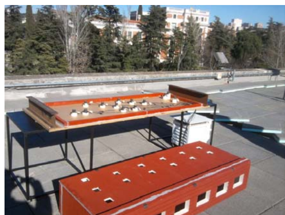
Fig. 3: Distribución de los sensores en el modelo

Esta parte de la investigación ha dado lugar al trabajo fin de Máster “ Optimización de la Iluminación Natural en un aula de la ETSAM utilizando un modelo a escala y un modelo de simulación virtual ” del Máster en Técnicas y Sistemas de Edificación de la EUATM realizado por el alumno Javier Rincón Esteban (Junio 2011). En dicho trabajo también se ha estudiado la respuesta luminosa que recibe el aula mediante un software de simulación (DIALux 4.7).