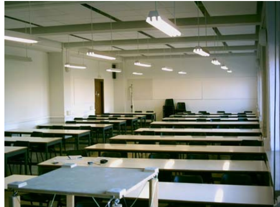
Figura 1: Interior Aula 2G5, vista desde el este.

En esta segunda etapa las medidas de iluminancias se están aplicando a la edificación. Se ha construido un modelo a escala (1/12) de un aula de la Escuela Técnica Superior de Arquitectura de Madrid (Fig. 1 y 2) [5] y se han medido iluminancias horizontales en dicho aula y en su modelo a escala, simultáneamente, durante cuatro meses, con todo tipo de cielo (despejado, parcialmente cubierto y cubierto) y cualquier hora del día con la finalidad de realizar un estudio comparativo entre ambas, verificar la viabilidad del modelo y obtener los factores de escala.