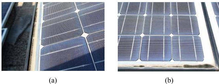
Figura 3. Defectos visuales aparecidos en los módulos tras 16 años de funcionamiento: (a) roturas y (b) musgo en la unión entre el marco metálico y el laminado.