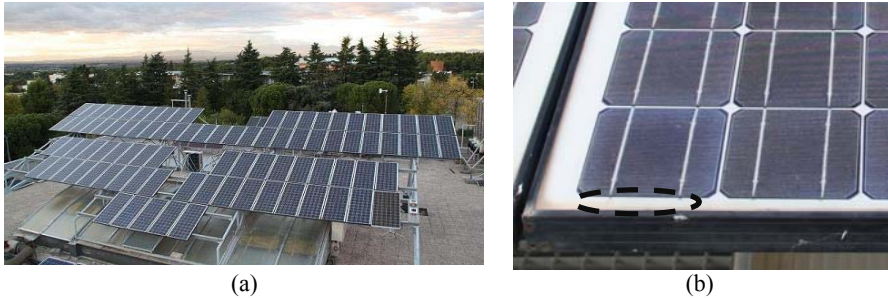
Figura 1. (a) Vista general de la instalación. (b) Vista en detalle de uno de los módulos. La separación de 2 cm entre el marco y las células en la parte inferior del mismo ha evitado que la suciedad afecte al rendimiento energético y a la seguridad eléctrica.

aislamiento eléctrico de los módulos ensayados puede entenderse como una de las buenas noticias de este artículo. Este hecho es particularmente interesante ya que las pruebas de degradación acelerada (ciclado térmico y rampas de calor) recogidas en la norma IEC-61215 no dan lugar a delaminaciones en los módulos, de modo que el posible riesgo eléctrico asociado a las mismas no puede ser analizado en módulos sometidos a envejecimiento acelerado, sino solamente en aquellos que han envejecido de manera natural, tras muchos años de exposición a los elementos.