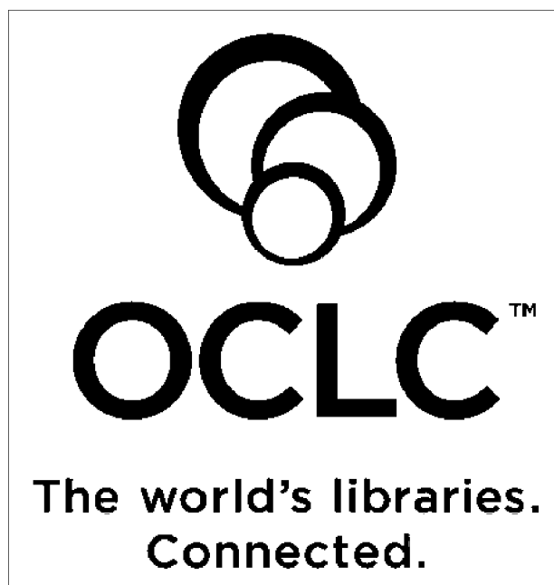
Nuevo logo de OCLC.

Posteriormente, en enero de 2002, OCLC-EU se une a Pica , una sociedad con semejantes orígenes a los de OCLC, también creada en los 60 y formada por un sistema cooperativo de bibliotecas; y ubica sus oficinas centrales para Europa en Leiden (Holanda).