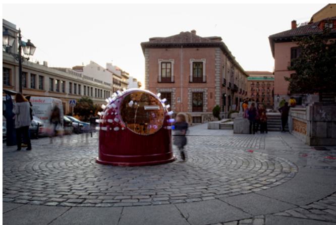
Figura 5. LA HUCHA DE LOS DESEOS. Fotografía durante la intervención en la Plaza de los Carros. Susanne Bosch.

El proyecto sirvió también para crear vínculos y generar un sentimiento de ciudadanía y comunidad al encontrar afinidades en un proyecto conjunto.