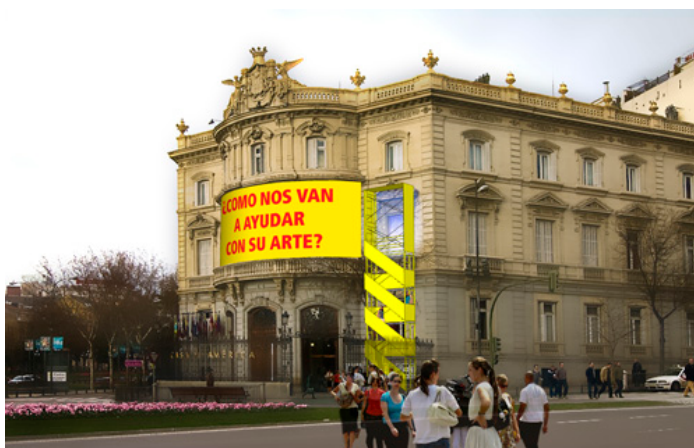
Figura 2. VALLECAS; ¿CÓMO NOS VAN A AYUDAR CON SU ARTE?. Croquis previo a la intervención. Teddy Cruz, M7Red y Iago Carro

La Fachada de la Casa de América como sitio de producción. El texto contextualiza emblemáticamente la intervención al aplicar en la fachada una pregunta que un inmigrante paraguayo expresó a un grupo de artistas durante un dialogo en Villa 31, un asentamiento informal dentro de Buenos Aires, en el que Teddy Cruz y M7Red colaboraron. (explicación actualizada de la hecha por los artistas en Madrid Abierto)