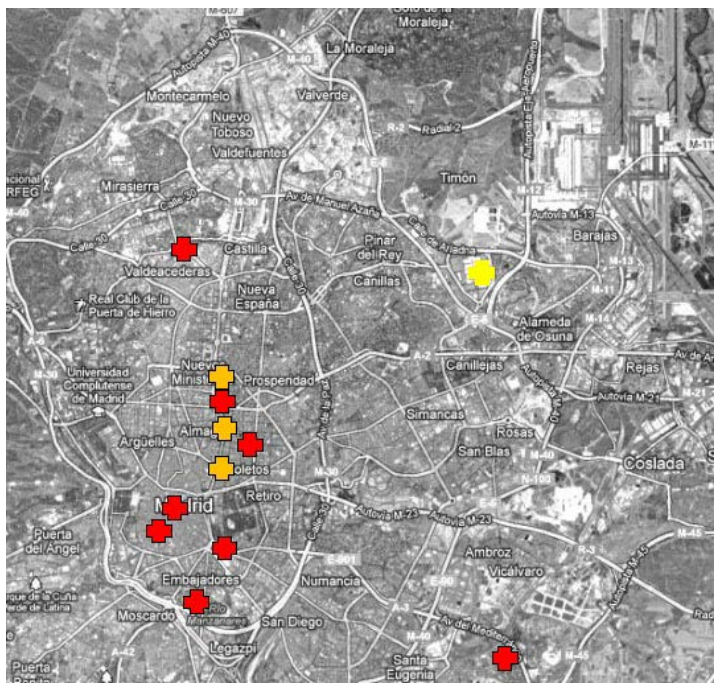
Figura 6. Localización de intervenciones de Madrid Abierto. En amarillo 2002, naranja 2004-2008 y rojo 2009-2011.

Esperamos que el éxito de las ediciones así como el camino que iba tomando hacia transformarse en un recurso para la catársis social permita recuperarlo en un futuro.