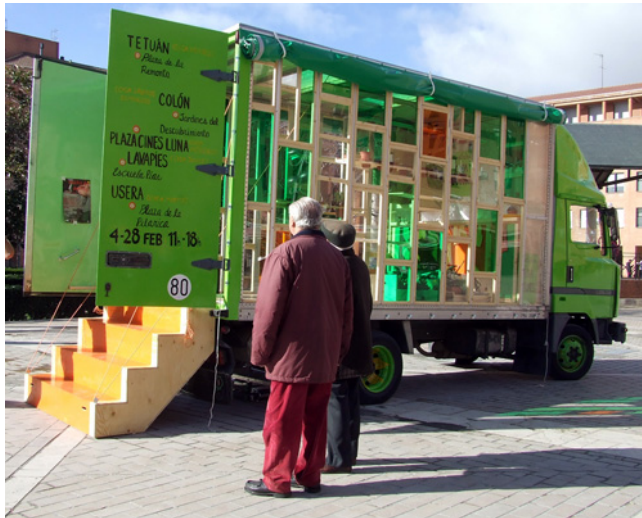
Figura 5. HUERT-O-BUS. Fotografía durante la intervención en la Plaza de la Remonta. Lisa Cheung.