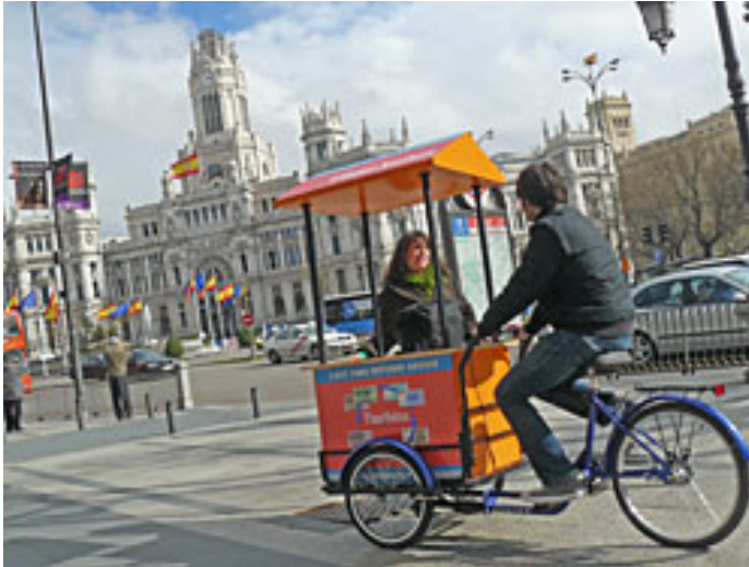
Figura 4. TIME NOTES. Fotografía durante la intervención en la Plaza de Cibeles. Gustavo Romano.

El proyecto Time Notes aglutinó una serie de acciones en espacios públicos utilizando un nuevo sistema de dinero basado en unidades temporales: billetes de 1 año, 60 minutos, etc., y en cuyo reverso pueden leerse diversas citas de filósofos, escritores o economistas acerca del tiempo o del dinero. (Tiempo perdido y préstamo del tiempo) (explicación actualizada de la hecha por el artista en Madrid Abierto)