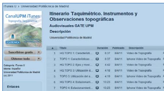
Figura3. CanalUPM iTunes U