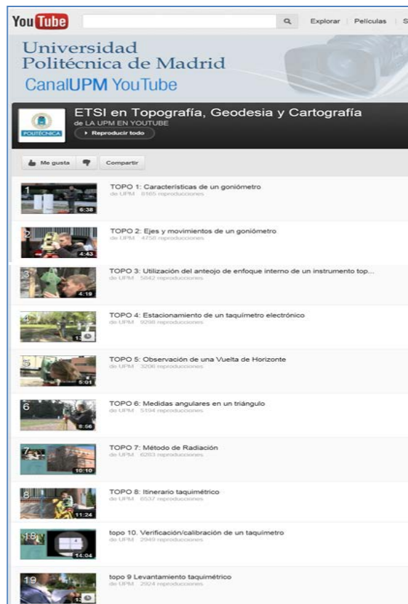
Figura 2. CanalUPM YouTube . Lista reproducción ETSITGC

CanalUPM iTunes U (Benito & GATE-UPM, CanalUPM iTunes. Categoría iTunes U, 2011)