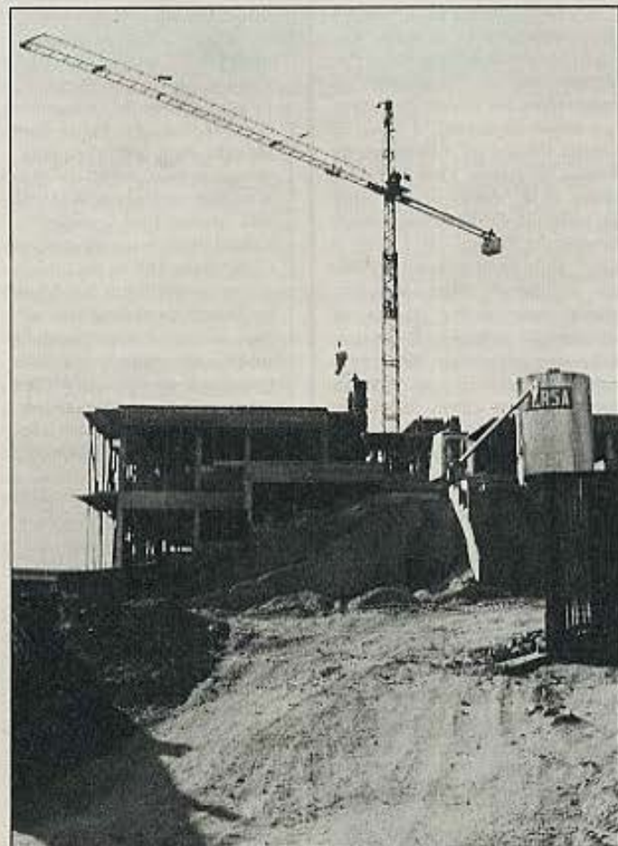
La arquitectura de la segunda mitad del siglo XX viene caracterizada por una falta de atención creadora.

Las condiciones imperantes del tiempo que nos toca vivir, más lúcidas por fortuna que algunos de los argumentos profesionales de esta controversia, clarificarán, sin duda, el proceso histórico de esta actividad humana dedicada a formalizar por el hombre el espacio ambiental de sus semejantes y que conoce-