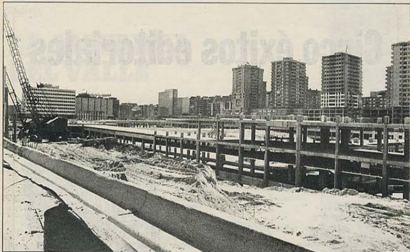
A nadie se le oculta que las necesidades de expansión industrializada de la empresa —obsérvese el trasvase de empresas constructoras a promotoras inmobiliarias como fenómeno inversor— representa para la arquitectura una ideología negativa.

dependiente, de las presiones político-tecnocráticas de la sociedad industrial.