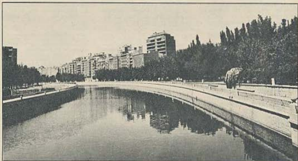
El río Manzanares nunca ha sido un río urbano para Madrid.

La descomposición de las fuerzas de gestión municipal con organismos tan diversos como los