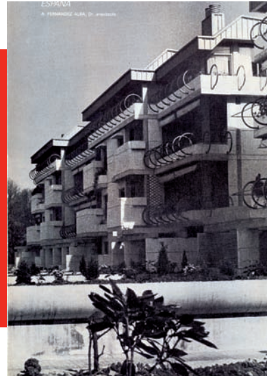
Página de artículo Revista Informes nº 146

1.- Los años de la década 1950-1960 del siglo 20 la situación político - cultural en España, no ofrecía muchas alternativas al reducido periodo ilustrado que significó la República Española de las décadas precedentes, de manera que la edición e información de libros y publicaciones era restringida y canalizada a través de la producción editorial de países de habla española como Argentina, México o bien revistas técnicas, francesas, inglesas y alemanas, que publicaban con detalle los documentos de los proyectos junto a cuidadas imágenes fotográficas. Respondían a una crónica fidedigna de los procesos constructivos y al desarrollo y reconstrucción de las ciudades europeas en aquella postguerra, donde un optimismo trágico enlazaba con un vacío espiritual, producido por la fractura que había significado el conflicto bélico de la segunda guerra 1939-1945.