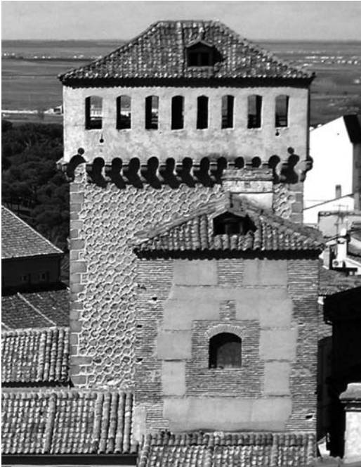
Figura 12 Vista comparativa entre las dos torres realizada desde el edificio del seminario (foto de la autora 2012)

características similares entre ambas. El remate de las dos torres marca una diferencia característica, mientras que la torre una tiene su característico adarve volado, la torre dos tiene una discreta cubierta inclinada a tres aguas. Ambas torres tienen una estructura de cubierta de madera y una cubrición con teja colocada a canal.