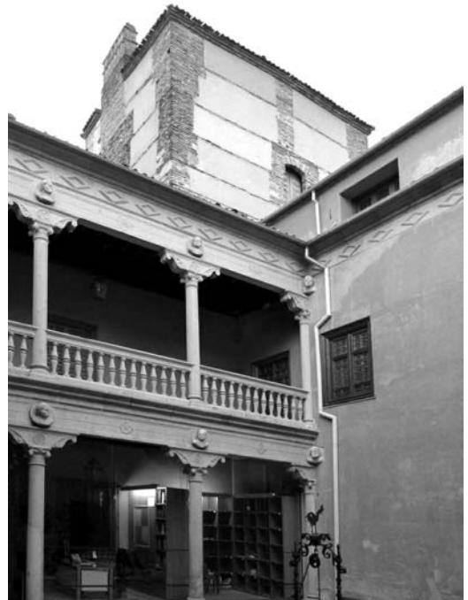
Figura 9 Torre dos, vista desde el interior del patio porticado

El acceso a los niveles superiores se realiza a través de una única puerta situada en el actual bajo cubierta del ala este del patio, subiendo unos peldaños y entrando en el espacio que conforma la torre en los dos niveles siguientes de espacio rectangular con una superficie de treinta y seis metros cuadra-