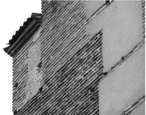
Figura 11 Aparejo de ladrillo y cajones de tapial

dos. Como remate superior tiene actualmente una media altura y una cubierta de estructura de madera a tres aguas cubierta con teja cerámica colocada a canal.