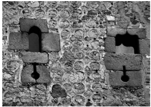
Figura 6 Aparejo característico y ventanas del nivel cuarto

El remate superior de la torre tiene un adarve volado sobre arcos de ladrillo que apoyan en una ménsula de granito de doble elemento, sobre el que se cons-