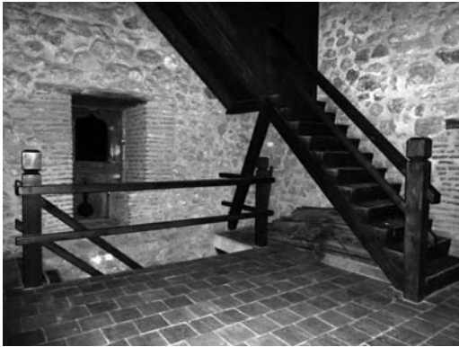
Figura 8 Escalera interior de la torre una

Los huecos se diferencian en tres categorías. La puerta adovelada que da entrada al edificio junto a la que se encuentra un discreto elemento de defensa en forma de aspillera lateral que dirige la mirada a la entrada; las ventanas que se distribuyen por las tres plantas interiores y que disponen todas ellas de una aspillera de vigilancia y defensa situada bajo las ventanas. El acceso desde el edificio a los niveles superiores de la torre se realiza a través de una única puerta situada en la planta primera, subiendo unos peldaños y dando entrada al espacio interior de la torre que tiene una dimensión de treinta y ocho metros cuadrados, en cada uno de los tres niveles. Se remata con el nivel superior construido sobre el mencionado adarve volado.