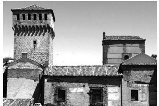
Figura 2 Lateral de las dos torres y del conjunto edificado, desde la torre de la casa Cascales-Barros (foto de la autora 2013)

dos patios con galería en uno y dos lados respectivamente. Dispone de dos plantas completas en torno a dichos patios, una planta sótano que ocupa parte de ellas y las dos torres que se elevan sobre las cubiertas del resto del edificio en dos y tres plantas respectivamente. Observando la composición por crujías construidas con estructuras independientes. La dualidad que supone tener dos torres tan próximas en una misma propiedad, hace pensar en la pertenencia inicial a dos casas diferentes, apoyándonos en la documentación de la compra en el siglo XVI, a dos propietarios distintos.