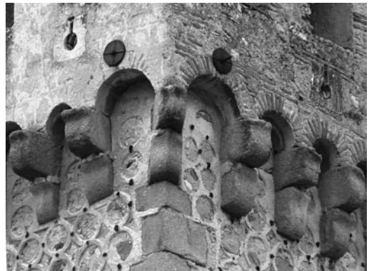
Figura 7 Remate superior de la torre con adarve volado