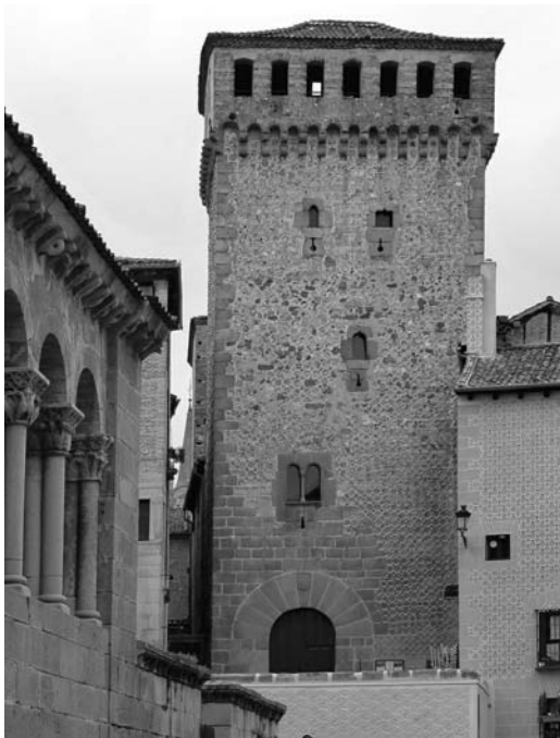
Figura 5 Alzado principal de la torre una (foto de la autora 2013)

Conocida como Torreón de Lozoya, es la imagen reconocible de la casa-torre que nos ocupa, tiene cinco niveles interiores, el inferior tiene una gran puerta