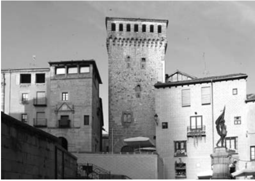
Figura 1 Torreón de Lozoya junto a otras casas de la plaza de San Martín

sólida y sencilla, rematada por cornisa de matacanes y adarve, hoy cubierto; calada por la severa puerta adovelada, y por pocas y pequeñísimas ventanas, algunas sobre aspilleras cruciformes. Penetrase bajo la torre en un zaguán defendido; a la derecha, el muro fue abierto para comunicarse con el nuevo palacio, que se agregó a ella. Se entra en el patio, que según la manera segoviana, solo tiene galerías en dos lados. Le rodean la escalera sin crujía detrás y varias salas y cuadras. Y al fondo, hay un riante jardín, con un frente en galería. Esta y la del palacio son análogas, tienen esa bella composición de columnas, zapatas y dinteles con medallones, tan típicamente española en la arquitectura civil de la primera mitad del siglo XVI. A esta época pertenece, en efecto, el palacio; la torre es del siglo XV. Puede suponerse que aquél substituyó a otro, del que solo se conservó ésta. El conjunto caracteriza bien el palacio segoviano. (Lampérez 2012 [1924], 444)