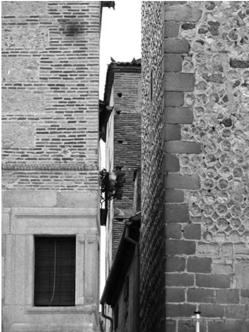
Figura 3 Callejón lateral que permite observar las dos torres