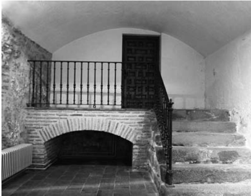
Figura 10 Sótano de la torre una (foto de la autora 2013)