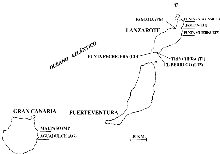
Fig.1.- Situación geográfica de las muestras.

^ Punta Pechiguera (LT4) y el Berrugo (LT5) corresponden a niveles del Eem con Strombus bubonius de los que se poseen abundantes dataciones con U/Th que se agrupan en torno a 90-100ka, Meco (1977).