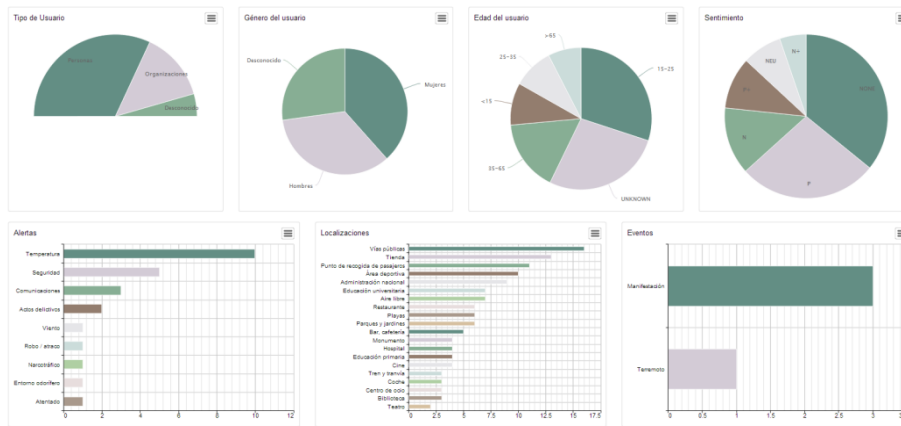
Figura 4. Consola de información de usuarios, sentimientos y alertas

La Figura 4 presenta varias gráficas de tarta con estadísticas de usuario (número de usuarios por tipo, rango de edad y sexo), y la polaridad global de sentimientos, y una lista de las alertas, ubicaciones y eventos más frecuentes detectados en dicho periodo.