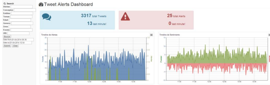
Figura 3. Consola de visualización con filtros, estadísticas y timelines

La Figura 4 presenta varias gráficas de tarta con estadísticas de usuario (número de usuarios por tipo, rango de edad y sexo), y la polaridad global de sentimientos, y una lista de las alertas, ubicaciones y eventos más frecuentes detectados en dicho periodo.