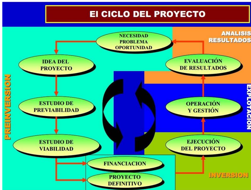
Figura 2. Ciclo del proyecto según Trueba (1995)

El contexto descrito en el epígrafe anterior generó la necesidad de crear un ente destinado a fomentar un desarrollo vertebrado en la zona de Cayambe fundamentado en la participación ciudadana.