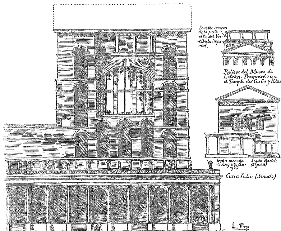
Estructura supuesta de la fachada lateral y detalle del relieve del Museo de Letrán y de la Curia Julia.

en las Termas, y que los lados largos tuvieron ventanas pequeñas en varios niveles, al menos en la fachada de la plaza, o sea la del oeste. Esto va bien con la estructura de la bóveda y contrafuertes; pero, además, puede asegurarse que los lados oeste y este, o por lo menos el primero, debieron de tener en lo alto inmensos ventanales del tipo de los usados en los lados cortos, pero aun mayores. No hubo ventanas pequeñas en los lados cortos, porque no hubiera sido posible hacerlas al no coincidir los ejes de los contrafuertes exteriores con los de la cara interior, que tenían ejes muy claros marcados por las hornacinas. Una desviación de las ventanas respecto de las hornacinas se hubiese