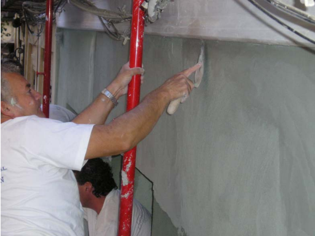
Ilustración 9: tendido y fratasado de capa final