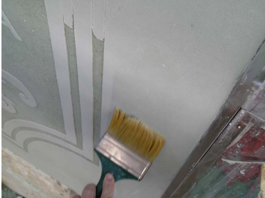
Ilustración 17: limpieza final, expulsando el grano