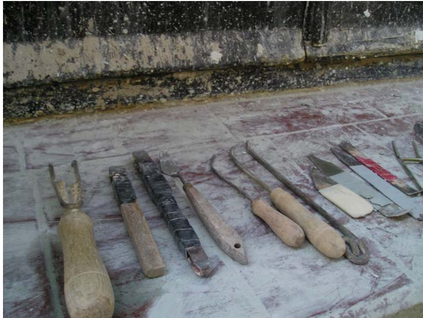
Ilustración 5: herramientas para el esgrafiado

En cuanto a las herramientas que se emplean, una vez tendido el mortero, se utiliza las navajas o cuchillas para cortar el dibujo (siempre a 45 grados, para que la masa no retenga el agua de lluvia) y las espátulas, gubias o cucharillas para vaciar. La mayoría de las herramientas utilizadas son tan artesanales como el propio oficio, muestra de ello son las que aparecen en la fotografía inferior, con las que realizaron la obra objeto de estudio.