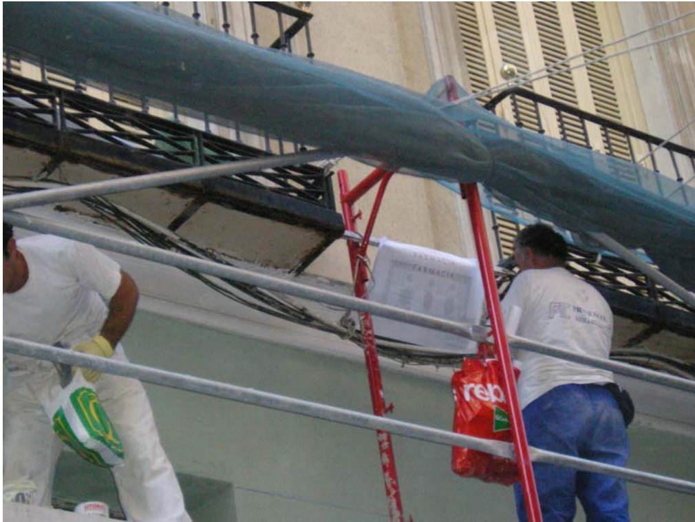
Ilustración 7: replanteo de fachada