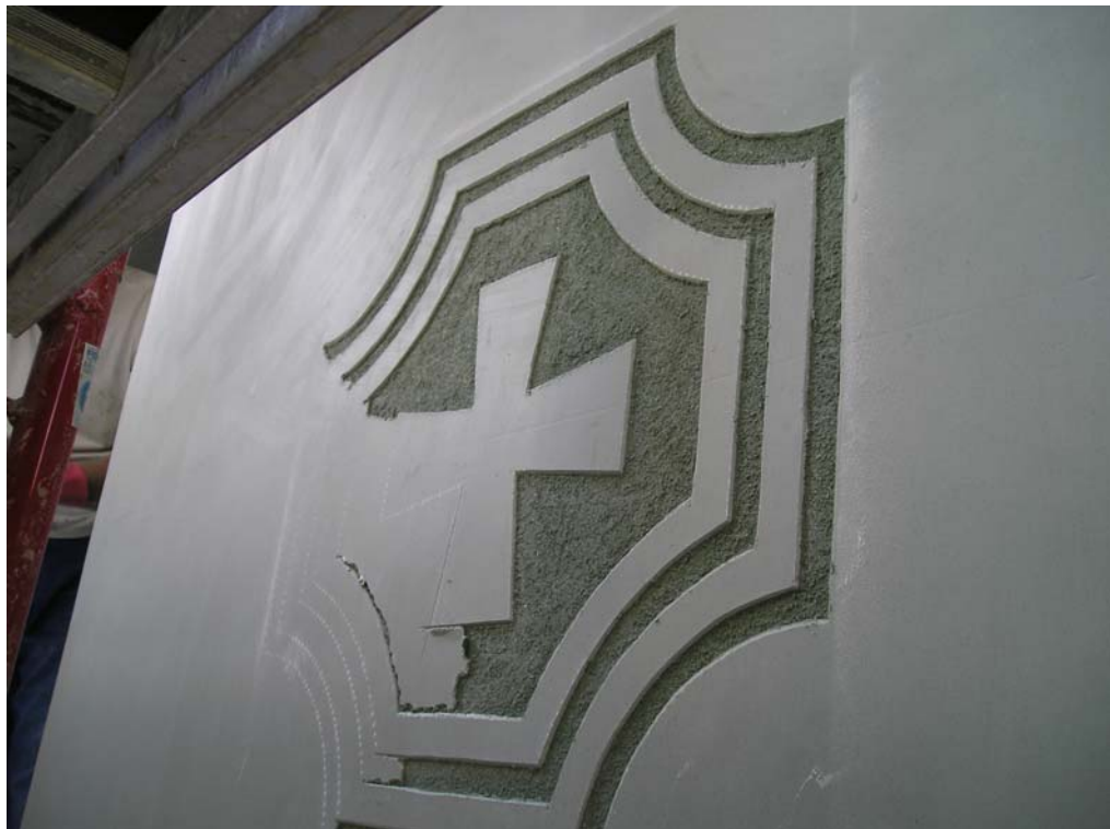
Ilustración 14: detalle ornamental

Así sucesivamente fueron realizándose los diferentes detalles ornamentales, revocando a la vez las zonas ciegas y descendiendo hacia el zócalo.