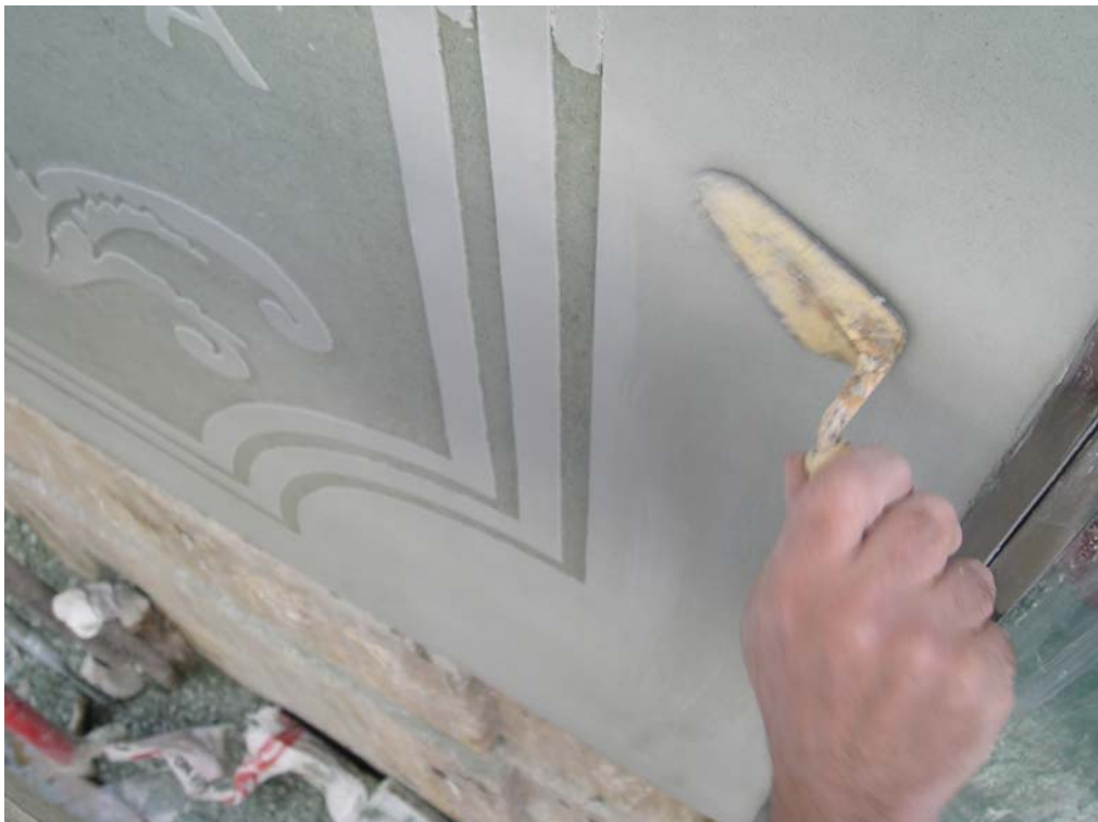
Ilustración 16: pulido a paletín