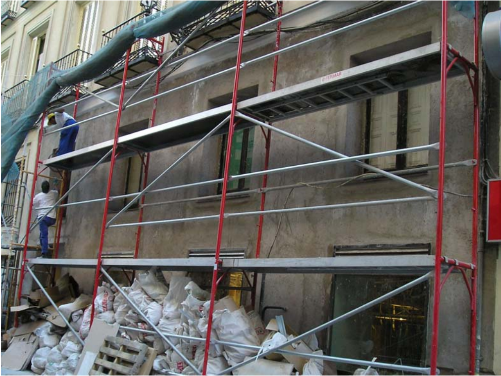
Ilustración 1: Estado Actual

Después del trabajo de esgrafiado con mortero de cal, el cambio experimentado en la fachada se puede apreciar en la siguiente fotografía.