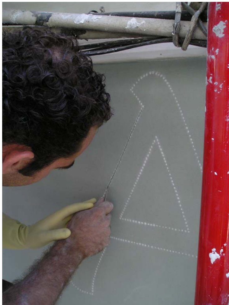
Ilustración 12: cortado de bordes