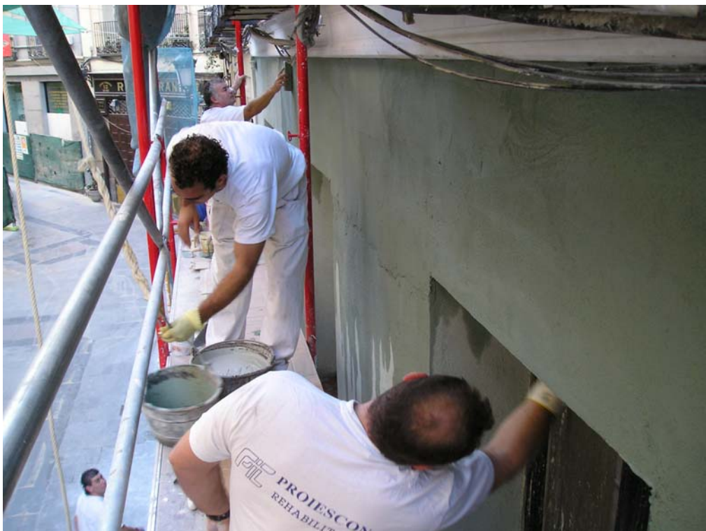
Ilustración 8: Tendido y fratasado de capa de fondo