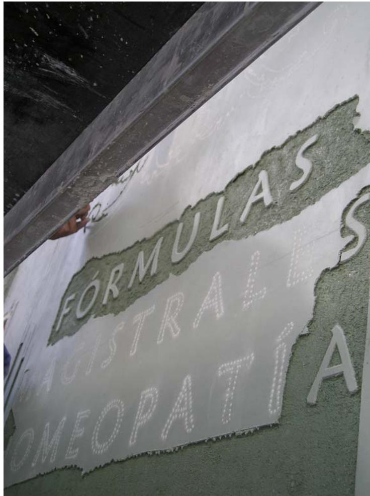
Ilustración 15: detalle de inscripciones