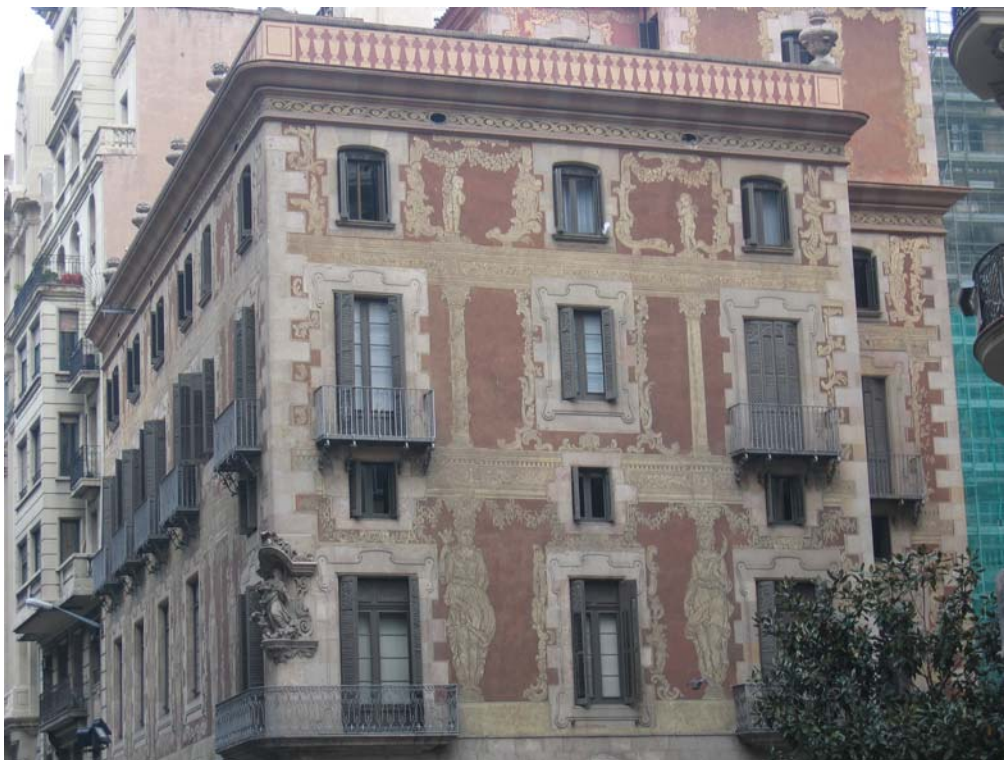
Ilustración 3: Fachada de Barcelona

Aunque existen innumerables muestras de ésta técnica en toda España lo cierto es que existen dos centros representativos: el esgrafiado segoviano, cuya técnica también se conoce como “aplantillada”, de raíces islámicas y caracterizado por que muchos de los motivos ornamentales repetitivos se confeccionan mediante plantillas y el esgrafiado catalán, de influencia italiana recibida a través de su situación como centro de distribución de mercancías mediterráneas, con mayor profusión de temas decorativos, florales o simbólicos.