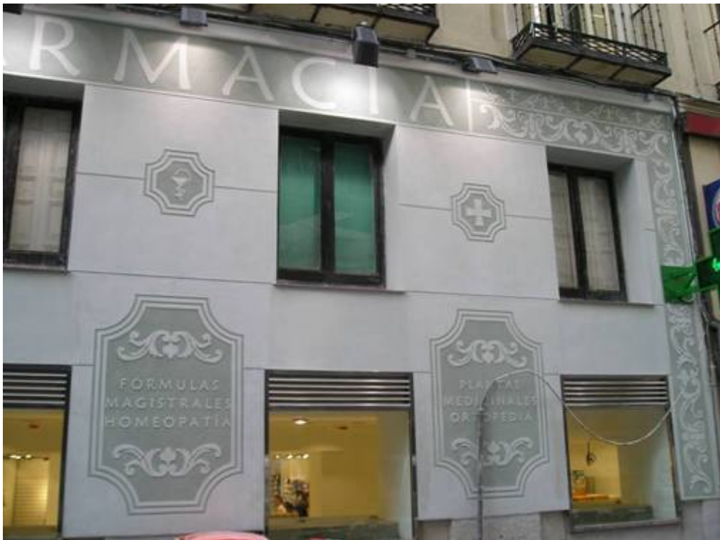
Ilustración 2: Estado Final

Después del trabajo de esgrafiado con mortero de cal, el cambio experimentado en la fachada se puede apreciar en la siguiente fotografía.