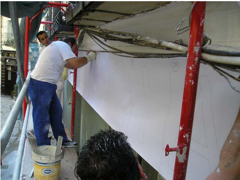
Ilustración 10: colocación de dibujo en papel