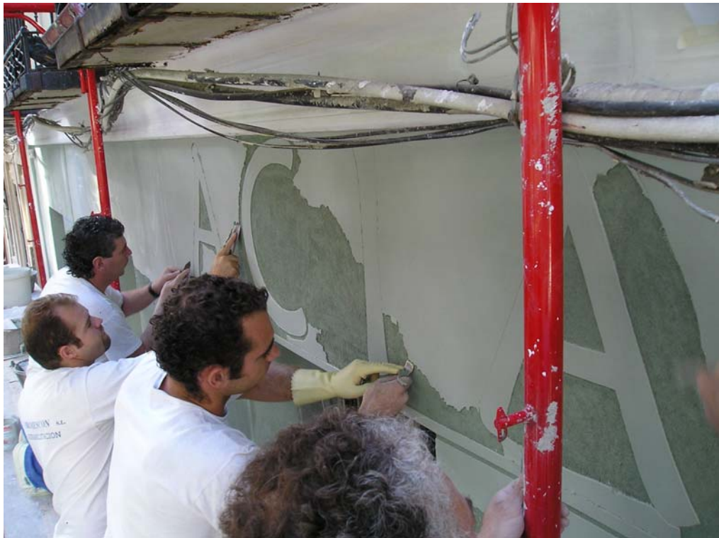
Ilustración 13: cortado y vaciado de dibujos

Así sucesivamente fueron realizándose los diferentes detalles ornamentales, revocando a la vez las zonas ciegas y descendiendo hacia el zócalo.