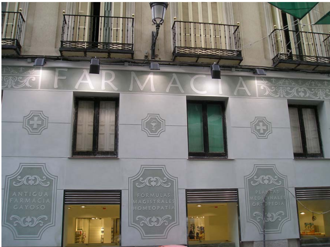
Ilustración 18: resultado final

El resultado final logra crear un espacio singular, diferente a los materiales actuales y que resalta los valores tradicionales y artesanales del negocio, a la vez que se integra en el caso antiguo de Madrid, recuperando las técnicas que las modas y la necesidad del cambio han desterrado.