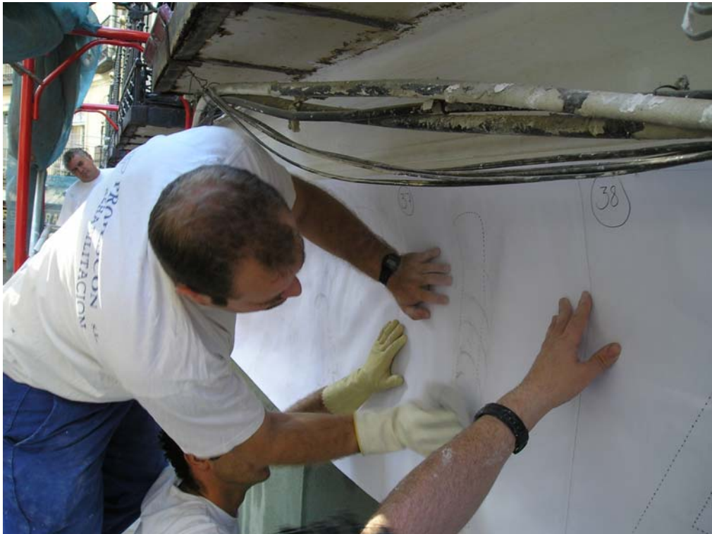
Ilustración 11: estarcido de dibujo