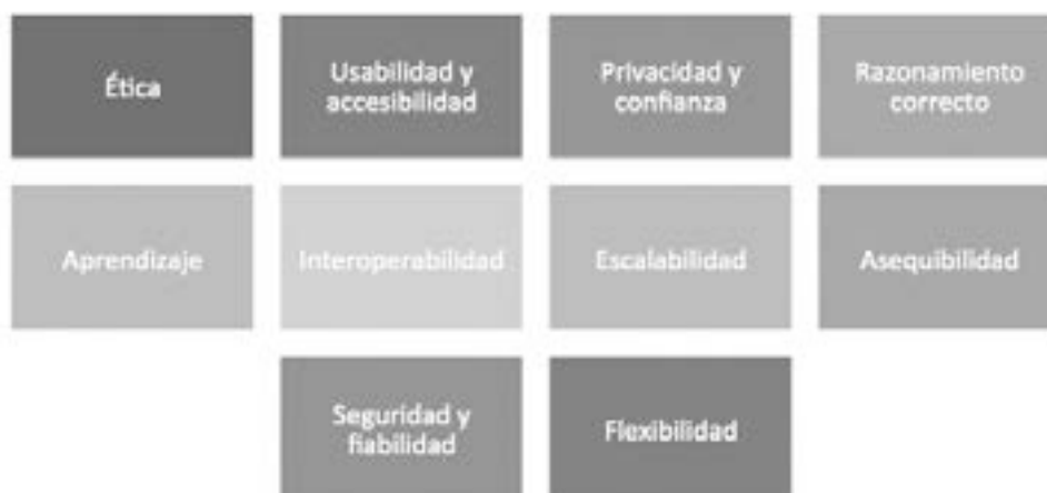
FIGURA 2 ASPECTOS ESENCIALES DEL HOGAR INTELIGENTE