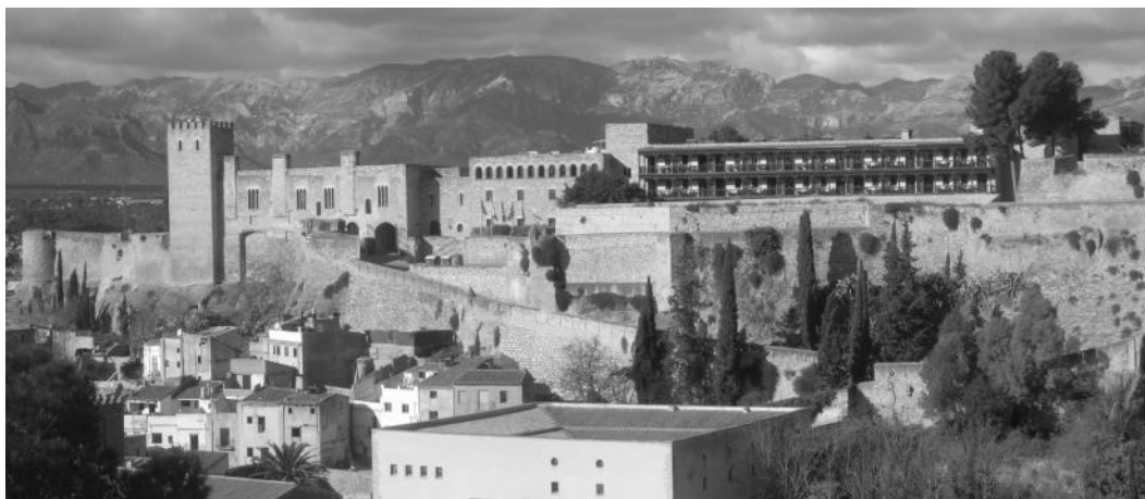
Figura 1. Fachada sur del parador de Tortosa, vista desde el Fuerte del Bonet.

El tipo arquitectónico residencial fue transcendental para la elección del inmueble, como lugar donde implantar un futuro parador (Picardo. 1969), a pesar de que éste se encontrase en estado de ruina, a lo que había que añadir el valor de antigüedad por ser la zona que había tenido los asentamientos más antiguos y donde se conservaban restos de la Edad Media, el período más valorado por el Ministerio para la implantación de sus paradores.