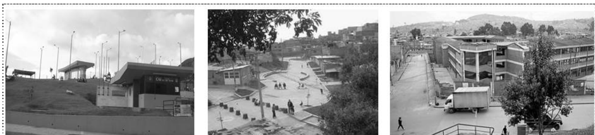
Imagen No.2 Intervenciones proyecto Sur Con Bogotá.

A nivel social, los avances se consolidaron con procesos participativos en los que se logró congregarse organizaciones comunitarias, sectoriales y generacionales para la elaboración de planes zonales en nuevos salones comunitarios construidos. Se amplió la cobertura de salud y nutrición por medio a la afiliación del SISBEN y la postulación en comedores infantiles. Se diseñaron 23 proyectos ligados a programas de convivencia con el Fondo de Desarrollo Comunitario y la cooperación internacional. Adicionalmente, se capacitó a la población objeto en economía solidaria y se prestó formación en la gestión para consolidar empresas solidarias (8 empresas fueron formadas). Como agregado, durante el proyecto se crearon 670 puestos de trabajo temporal en las obras de construcción.