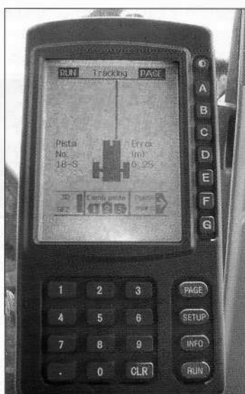
El monitor informativo de John Deere, con indicación de la pasada actual, el rumbo a seguir y el error cometido en cada instante.