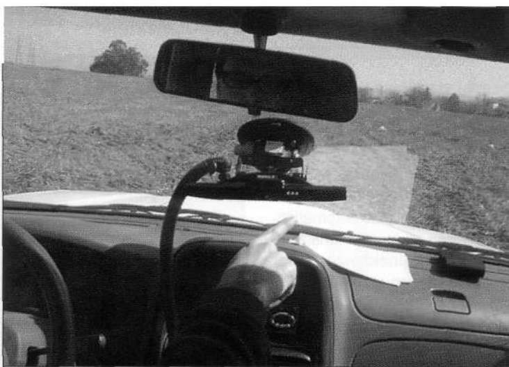
El uso de una barra de luces no puede ser más intuitivo: dejarse guiar por las indicaciones luminosas a derecha o izquierda.

tuvo la oportunidad de subirse a los tractores de John Deere y comprobar in situ la funcionalidad de sus sistemas. Asimismo, fue evidente la facilidad con que los tres componentes básicos (antena GPS, monitor y tarjeta) pueden ser desinstalados de un tractor para ser montados en otro: basta con enchufar los dos conectores estándar, esperar unos segundos a recibir la señal Starfire correspondiente y ponerse a conducir, incluso usando la pasada de referencia establecida con el primer tractor previamente.