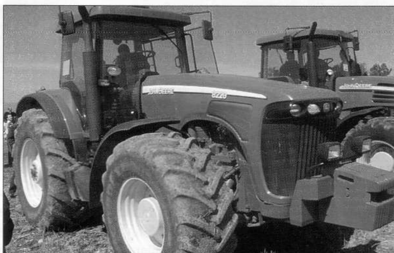
John Deere presentó sus sistemas Parallel Tracking y Autotrak en los dos tractores de la foto.

basan en comparar el rumbo teórico programado previamente en un ordenador con el rumbo real que lleva el tractor en cada momento. La información sobre el rumbo real puede proceder de diversos sensores electrónicos (cámaras de visión artificial, sistemas láser), aunque lo más común es que estos sistemas estén dotados de antenas de