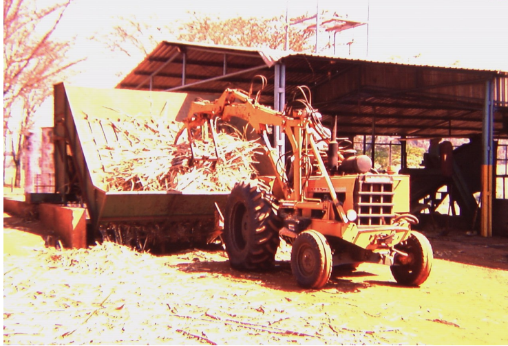
Figura 2. Ejemplo de fotografías de una unidad moderna típica de producción de azúcar moreno: recepción y descarga (1) y en cozimiento del jarope até azúcar (2).

Pol: es la concentración expresada en g de solución en 100 g de solución de una solución de sacarosa pura en agua.