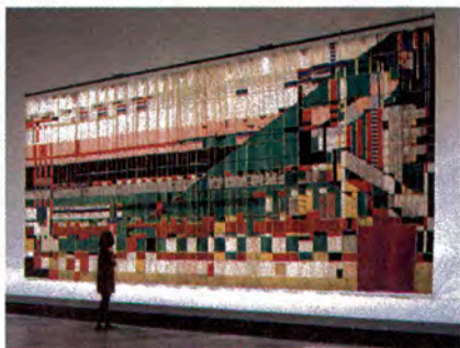
TELÓN DEL TEATRO HILLSIDE, 1952

ciar los cambios, las certezas y las dudas —algo así como los famosos arrepentimientos del maestro Velázquez— de la creación de unos espacios que no quieren ser limitados y contenidos por los muros, quieren ir más allá, libres,