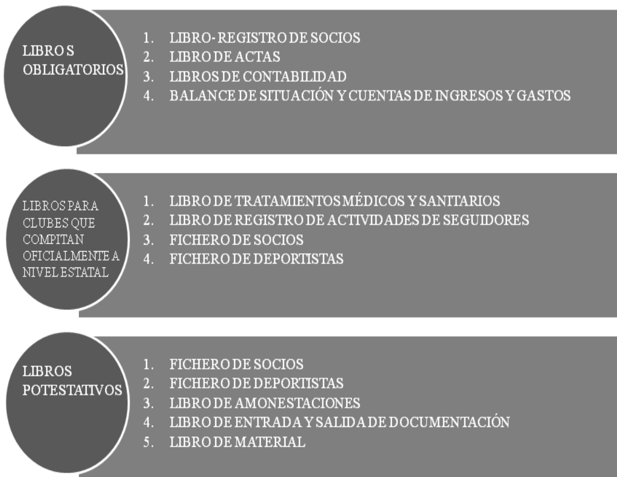
Figura 4. Régimen documental.