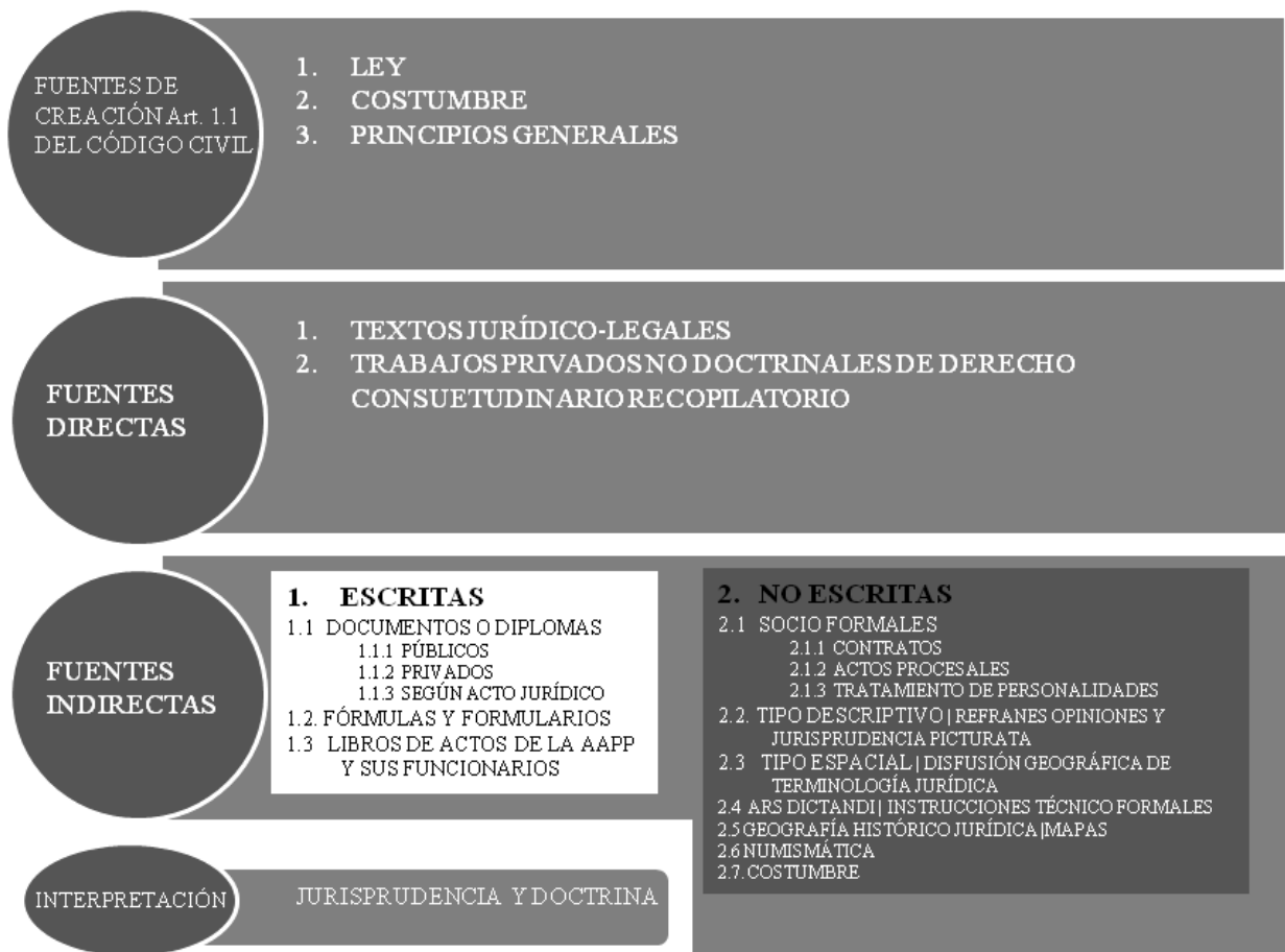
Figura 5. Fuentes utilizadas en la investigación.