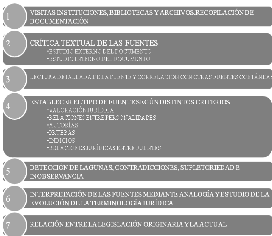
Figura 7. Fases del procedimiento de investigación.

Finalmente, se ha realizado un estudio comparado de diferentes Estatutos de clubes deportivos de las distintas etapas históricas con la normativa actual y se ha relacionado con la coetánea.