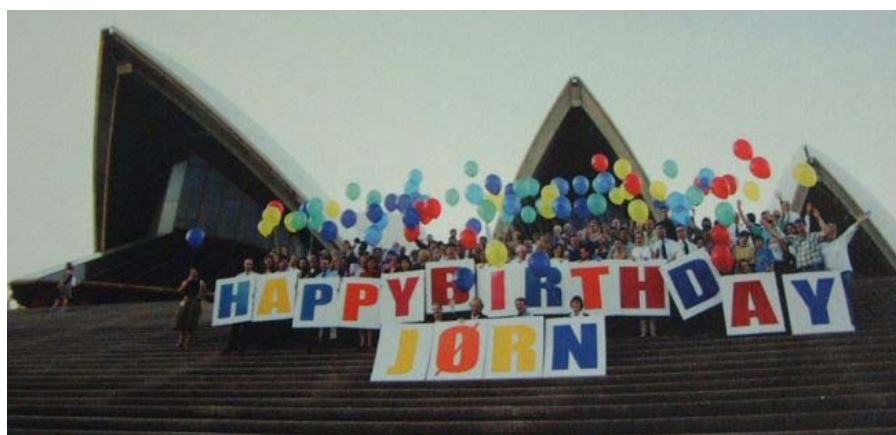
Los empleados de la Ópera de Sídney mandaron la felicitación a Utzon con motivo de su 86 cumpleaños en 2004.

Paseando por sus calles he comprendido que la Ópera es para los habitantes de Sídney mucho más que un teatro, es un auténtico imán, un foro en cuya escalinata se puede desarrollar cualquier tipo de actividad. Tan pronto funciona como graderío improvisado para un escenario al aire libre en el que celebrar un festival de cultura china, como cine de verano en el que se proyectan clásicos de Hollywood o como habitual zona de copas a la salida del teatro.