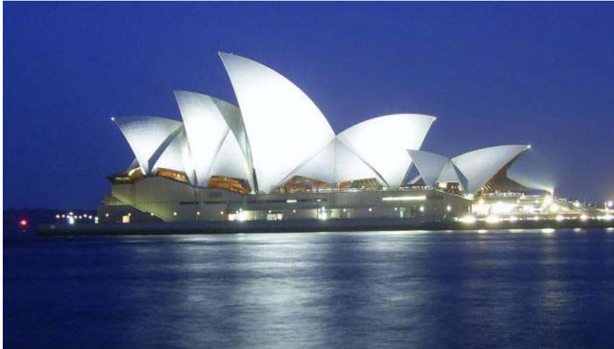
Imagen nocturna de la Ópera en la bahía de Sídney.

Como europea de a pie, he crecido dando por sentado que la arquitectura constituye el principal reclamo turístico de las ciudades.