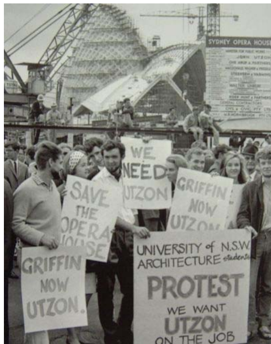
Manifestación popular celebrada el 3 de marzo de 1966 en la que se reclamaba la participación de Utzon durante la fase de las obras.

Un ejemplo de reclamo arquitectónico sin parangón es sin duda el edificio de la Ópera de Sídney del arquitecto danés Jørn Utzon , que sin lugar a dudas constituye uno de los mayores atractivos de este país continente.