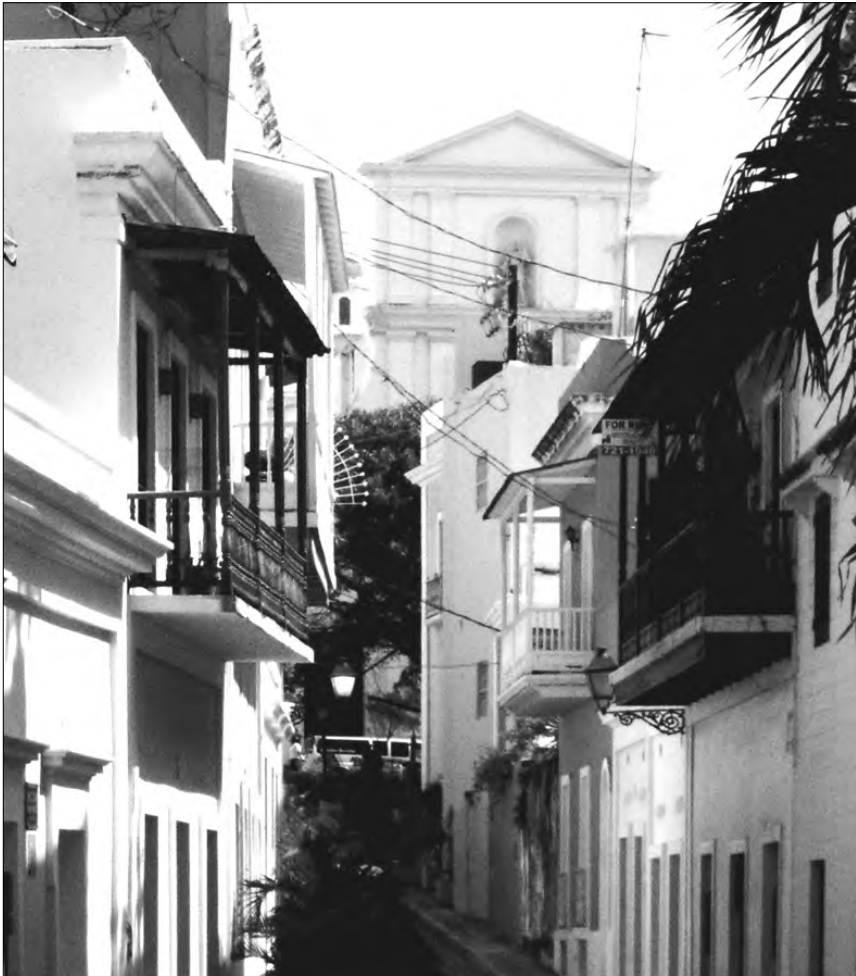
FIGURA 4: Balcones en la calle San Juan en la capital de Puerto Rico

Al contrario que los balcones canarios, entre los que abundan los de un solo vano, los balcones puertorriqueños suelen ser