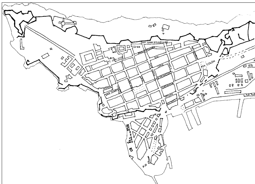
FIGURA 3: Plano del viejo San Juan (elaboración propia)

chos, suelos de ladrillos o de tablas bien ajustadas, patios grandes con profundos aljibes y persianas en sus puertas y ventanas. Las casas «dobladadas» lucían balcones abiertos en los pisos altos que, según la disposición de los vanos del piso bajo, podían ser corridos, alternos o individuales. La «originalidad» de cada balcón descansaba en el diseño que adoptaban las viguetas de su tejado, cuando lo tenían, y en los balaustres de madera o los trabajos de hierro que lucían sus antepechos. Estos balcones, de origen árabe, comenzaron a generalizarse en San Juan desde el siglo XVIII, pero fue en el XIX, con la multiplicación de viviendas de dos y tres pisos, que se desarrollaron a plenitud 53 .