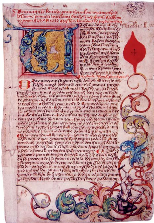
Figura 2. Manuscrito de la “lus regale montanorum” (Czech Mining Club).

En ese año de 1300 se abolieron los pagos con plata no acuñada declarándose obligatorio el uso de la moneda de plata, el gross praguense, dividida en 12 parvos. Esta nueva moneda se empezó a fabricar en la recién creada Casa de la Moneda de Kutná Hora, que se convir-