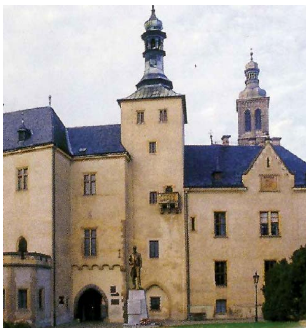
Figura 10. Corte italiana.

La Corte Italiana (Fig. 10) recibe este nombre por el origen de los artesanos italianos que fabricaban las monedas oficiales desde el edicto, de 1300, del rey Wenceslao II. Contaba con 17 herrerías, que simbolizaban las 17 antiguas cecas que fueron trasladadas a Kutná Hora. La producción de “ groschens ” de plata, fabricados desde 1300 hasta 1547, supuso la época de máximo esplendor de esta casa de acuñación, que cesó sus actividades en 1727, cuando la producción de moneda se trasladó a Praga. Desde entonces, la Corte Italiana sir-