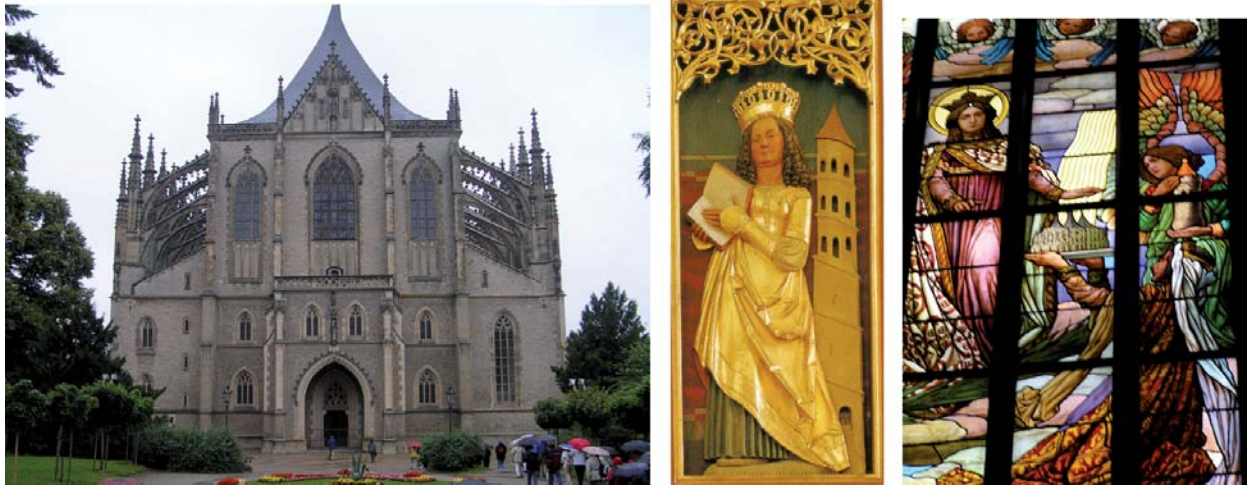
Figura 5. Izquierda: catedral de Sta. Bárbara de Kutná Hora. Centro: representación de Sta. Bárbara, altar mayor. Derecha: vidriera con Sta. Bárbara, capilla lateral.