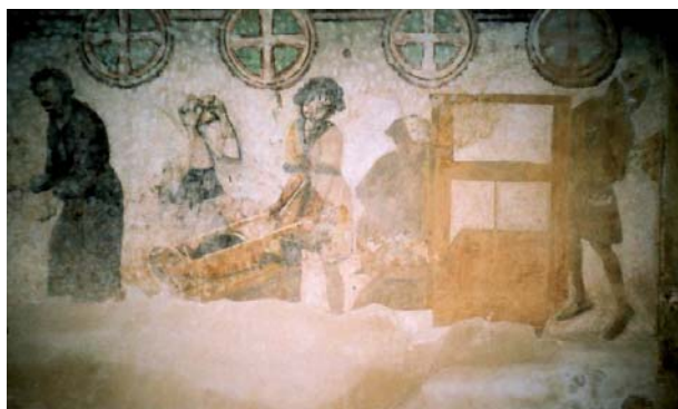
Figura 8. Escenas mineras en una capilla de la catedral de Kutná Hora.