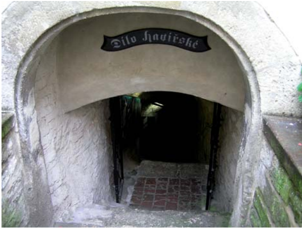
Figura 13. Acceso a la mina medieval.

Uno de los primeros objetos que se pueden ver en este museo es el gran malacate reconstruido (Fig. 12). También existe una mina subterránea, hoy en día visitable, descubierta en unos trabajos de prospección hidrogeológica (Fig. 13).