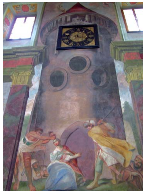
Figura 1. Pintura mural dedicada a Santa Bárbara, monasterio de Sedlce, Kutná Hora (Altoba, 2001).

Hacia 1260, en terrenos del monasterio, en un lugar llamado Mal-sov, se descubrieron unos veneros de plata. Pronto acudieron mineros alemanes desde Jihlava, población con explotaciones argentíferas situada más al sur. Las minas de Jihlava se habían descubierto unos 30 años antes y hacia 1249, junto con las minas de Stribro, tuvieron las primeras ordenanzas reguladoras del trabajo en las minas (Wasêk, 1994). Los mineros fundaron varias aldeas, próximas a las labores, una de las cuales se llamó Cuthna Antiqua. Sin embargo, parece ser que los antecedentes mineros de la comarca se remontan