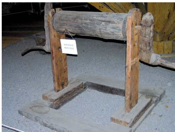
Figura 11. Torno manual.

El museo cuenta con exposiciones dedicadas a la ciudad, minería y metalurgia, acuñación, así como estilo de vida de la clase empresarial minera. También hay bienes muebles, paneles, láminas y equipos originales (Fig. 11).