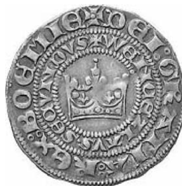
Figura 3. Gross praguense, realizado con plata de Kutná Hora.

tió en la única del Reino, ya que se cerraron las 17 cecas que existían en activo por entonces (Fig. 3).