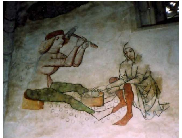
Figura 7. Frescos murales del siglo XV en la catedral de Sta. Bárbara, que muestran la acuñación manual de monedas en Kutná Hora.