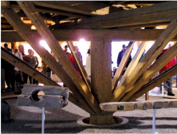
Figura 12. Malacate reconstruido, Museo Checo de la Plata.