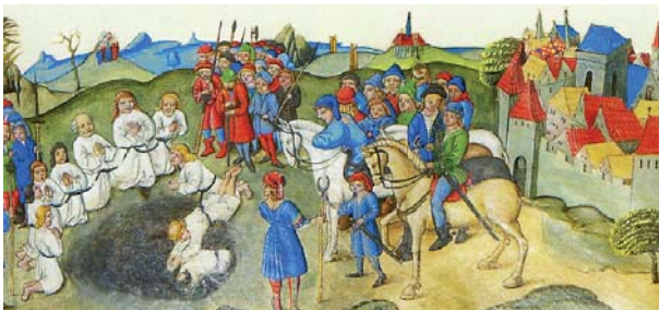
Figura 6. Lanzamiento de los husitas a los pozos mineros (Kulich, s/f).

relación histórica con el dólar norteamericano En 1535, el que sería conocido como rey Carlos I de España y V de Alemania, ordenó que las minas de plata del actual México, se acuñara una moneda similar a la que se utilizaba en Europa y que se nombraba como “thaler”. El thaler (o talero en español) era una moneda gruesa de