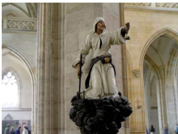
Figura 9. Minero penitente, catedral de Kutná Hora.

A mediados del XVI decae la minería local, cerrándose la mina “ Oselske pásmo ”. La profundidad que iban alcanzando las minas, el agotamiento de los veneros, así como la gran producción de plata en las minas alemanas y la llegada de los metales preciosos del Nuevo Mundo influyeron en estas circunstancias. Los intentos de renovar la minería en siglos posteriores fracasaron, hasta la recuperación del laboreo por parte de los alemanes en la II Guerra Mundial, actividad que se prolongó desde entonces hasta 1991.