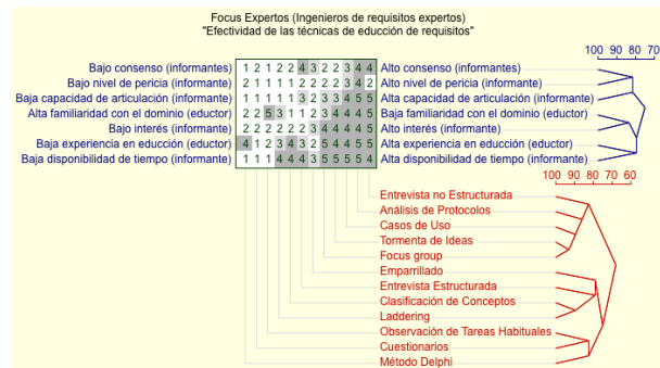
Fig. 2. Análisis de conglomerados para el ingeniero experto.

Estas figuras muestran los árboles con los que se ha analizado la equiparidad y similitud de las técnicas y las características. En ambas aparece una agrupación formada por la Tormenta de Ideas y Focus Group , con un 92,9% de equiparidad. Es la única coincidencia, pues el resto de agrupaciones de técnicas de noveles y experto difieren. Por motivos de espacio no se detallan más grupos ni porcentajes.