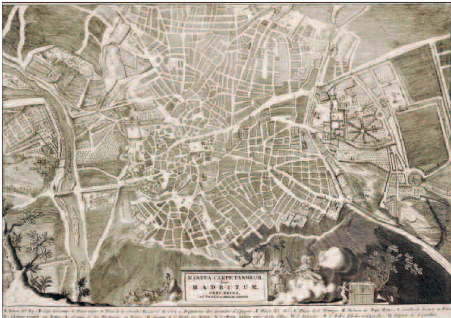
Mantua Carpetanorum sive Madritum, urbs regia, ad Guadarammam ammen