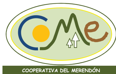
Figura 2. Imagen corporativa propuesta para la Cooperativa del Merendón (Honduras)

Se decidió que las políticas de producto fueran realizar una producción agraria sostenible, trabajar en conjunto con la FHIA (Fundación Hondureña de Investigación Agrícola). El producto se promocionará tanto en los supermercados como en las ferias agrícolas del país y el logotipo diseñado será el de la figura 3.