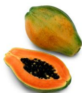
Imagen 1. Papaya

Este fruto es muy susceptible al maltrato durante su manipulación, siendo una característica que limita la exportación a gran escala. Brasil es uno de los principales productores de la fruta y la pérdida total de post-cosecha se estima del 10% al 40% de la producción total (Thomás, Galindo-Estrella 2009).