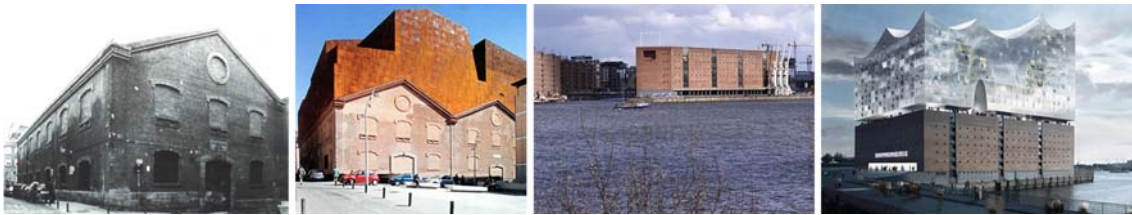
Fig.36 y 37. Herzog y de Meuron, Caixa Forum (Madrid), 2008/ Fig.38 y 39.: Herzog y de Meuron Filarmónica, (Hamburgo), 1993. Autores: HdeM.

Ampliar significa entender la arquitectura como una herramienta para establecer continuidades y diálogos en el tiempo. De alguna manera, su modificación y ampliación, si no niega, al menos atenúa y ralentiza su condición de consumo instantáneo y vindica su permanencia en el tiempo, más allá de las simples imágenes. Ampliar dota de nueva vida lo existente. Ampliar significa subrayar y poner en diálogo lo antiguo con lo nuevo. Podemos pensar en cómo se han ampliado hoy casos industriales como son el edificio del Caixa forum de Madrid o la Filarmonía en Hamburgo, ambos de Herzog y de Meuron, para ver, por la mera oposición de ambos, los peligros de dicha estrategia.