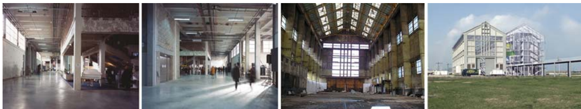
Fig.11 y 12. Lacaton y Vassal, Palais de Tokio, 2001 (Paris) / Fig.13 y 14. Lacaton & Vassal, FRAC Nord-Pas de Calais, (Dunkerque), 2009

A veces basta con limpiar. La sorprendente intervención que hicieron Anne Lacaton y Jean Philip Vassal en el Palais de Tokio, desveló la eficacia de la buena higiene, esa que no se preocupa por el lustre de las cosas, sino más bien de despojarlas de todas aquellas adherencias que impiden que se muestre como es. Con toda su crudeza.