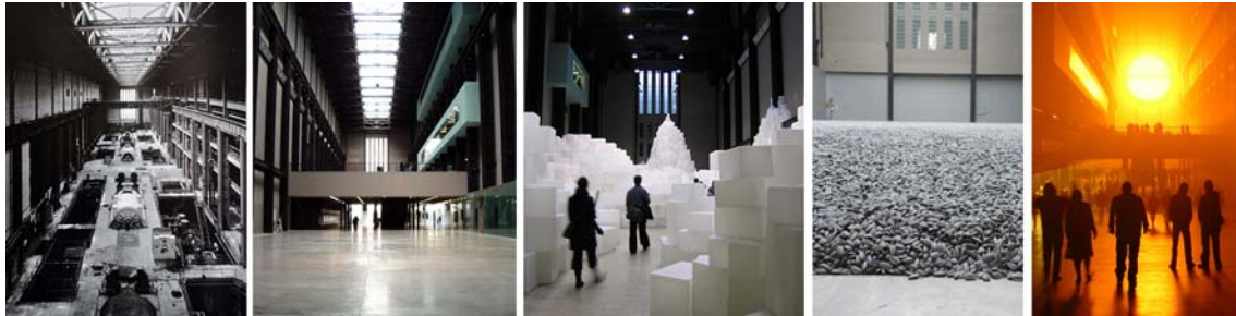
Fig. 6. Sir Giles Gilbert Scott, sala de turbinas estado original. Autor: desconocido/ Fig. 7. Herzog y de Meuron, Tate Modern Gallery, Londres, 1994, (Reino Unido), Fotografías: Tate/ Fig. 8, 9, 10. Intervenciones de Rachel Whiteread, Ai WeiWei y Olafur Eliasson, Autores: Tate y otros

El éxito de la sala de turbinas de la Tate Modern de Londres se debe en exclusiva al mero y simple hecho de mantener intacto el valor del vacío original. Ningún otro de los proyectos presentados al concurso puso en valor de igual modo ese trozo de nada monumental de Sir Giles Gilbert Scott.