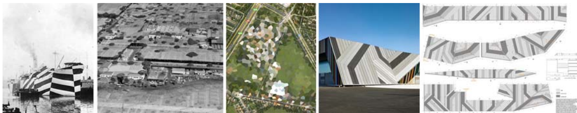
Fig. 31: HMS Nairana con Dazzle Painting. C.1918. Autor: desconocido/ Fig. 32. Camuflaje de la Lockheed Vega Factory en los Ángeles en 1942. Autor: Desconocido/ Fig. 33.: Pixelización en Google Earth de la instalación militar Korps Commandotroepen , en Roosendaal, Holanda. / Fig. 34 y 35.: Mercabarna- Flor. Almacén de flores de Barcelona. Willy Müller Architects. 2008 Autor: WMA

La cultura del ocultamiento y el disimulo tiene sin duda sus raíces más profundas en los distintos contextos bélicos que han asolado el planeta, y muy especialmente en las estrategias desplegadas durante las dos Grandes Guerras. Es en este periodo donde el camuflaje se instaura como disciplina, aglutinando el conocimiento de especialistas muy diversos: pilotos militares, fotógrafos, artistas, ingenieros, topógrafos, psicólogos y por supuesto también arquitectos. Estos últimos eran requeridos precisamente por su capacidad para leer el paisaje y por sus conocimientos de la teoría de la Gestalt, que paradójicamente se empleaba con el fin de crear imágenes ilusorias en lugar de clarificar la estructura interna del objeto.