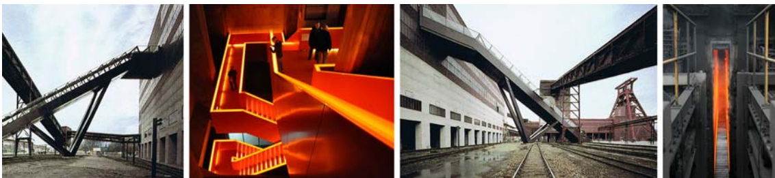
Fig. 15,16 y 17. OMA, Zeche Zollverein, 2002-2010, Essen, (Alemania). / Fig. 18. Coke pushers, Zeeburgee port, (Holanda)

Para Koolhaas, decíamos al comenzar, la sociedad actual flota en una descontrolada inundación de “espacio basura” en la que el acto del reciclaje arquitectónico es uno de sus manantiales inagotables. Para él, reciclar edificios conlleva vaciarlos de contenido, trivializarlos y borrar todas las huellas de su auténtico sentido: