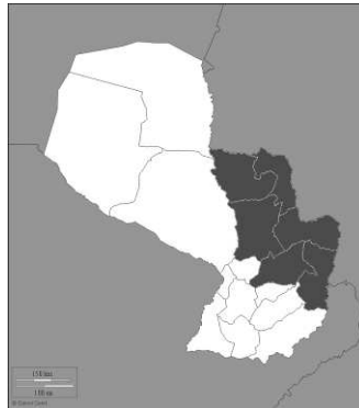
Figura 2. Mapa de Paraguay, mostrando en verde el área de distribución de Stevia rebaudiana .

Shock, 1982). La fundación Moisés Bertoni a través de su libro Biodiversidad de Paraguay asegura que se ha extinguido en su hábitat natural debido a un uso indiscriminado y a la desaparición de su hábitat (Mereles, 2007). Según Núñez (2010) la estevia crece en un clima subtropical y semihúmedo, con precipitaciones que oscilan entre 1.400 a 1.800 mm distribuidas durante todo el año y temperaturas de -6°C a 43°C, con promedio de 24°C. Durante el invierno su parte aérea se seca, rebrotando desde la base en primavera.