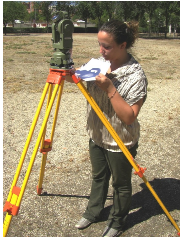
Figura 2.- Determinación diurna de acimut

La utilización del observatorio robótico eliminaría completamente el riesgo de que el alumno mire al Sol directamente a través del antejo y evitar así posibles accidentes. Además, se puede evitar que el alumno permanezca a pleno sol durante la realización de las prácticas.