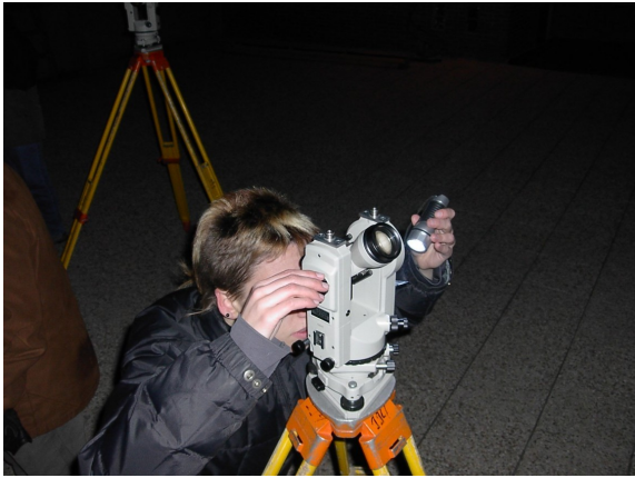
Figura 1.- Determinación nocturna de acimut

semanales de teoría y prácticas en la que se intercalan ejercicios prácticos destinados a planificar una observación y a calcular coordenadas de estrellas o astros con datos de observación directa con equipos dotados de goniómetros o teodolitos, que también se ejecutan. Para aprobar la asignatura es necesario la realización de un examen y unas prácticas. En el curso académico 2008-2009 tuvo 118 alumnos matriculados. Entre las prácticas que se realizan se incluían la determinación de acimutes astronómicos mediante la medición de ángulos con teodolito a la estrella polar (nocturna) y al Sol (diurna), véase figura 1.