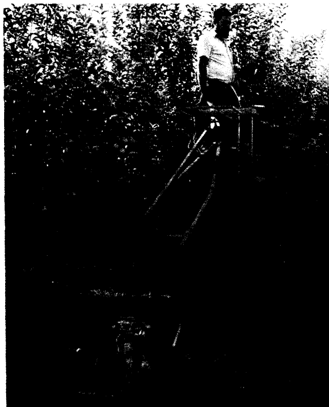
1 Plataforma individual para recogida de frutas.

En estudios sobre los tiempos de trabajo de los operarios que recogen fruta se ha determinado que entre la cuarta parte y la mitad del tiempo de trabajo se gasta