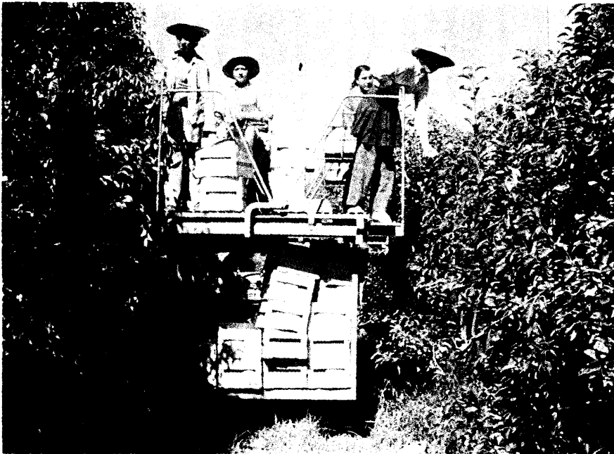
2 Plataforma múltiple cargando la fruta en cajas.

en colocar la escalera, subir, bajar y depositar la fruta en su recipiente. Aún no se ha conseguido un sistema mecánico que elimine la mano del hombre y no produzca daños a la fruta. Lo que se ha hecho es tratar de eliminar el tiempo perdido en subir, bajar y desplazarse; así, las plataformas colocan al operario en la posición idónea para alcanzar la fruta y,