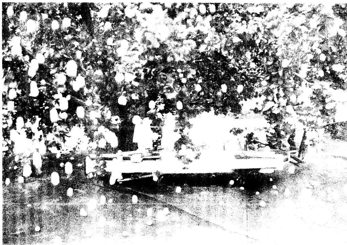
Vibrador 6 derribando albaricoques.

La máquina que se suele emplear para derribar el fruto del