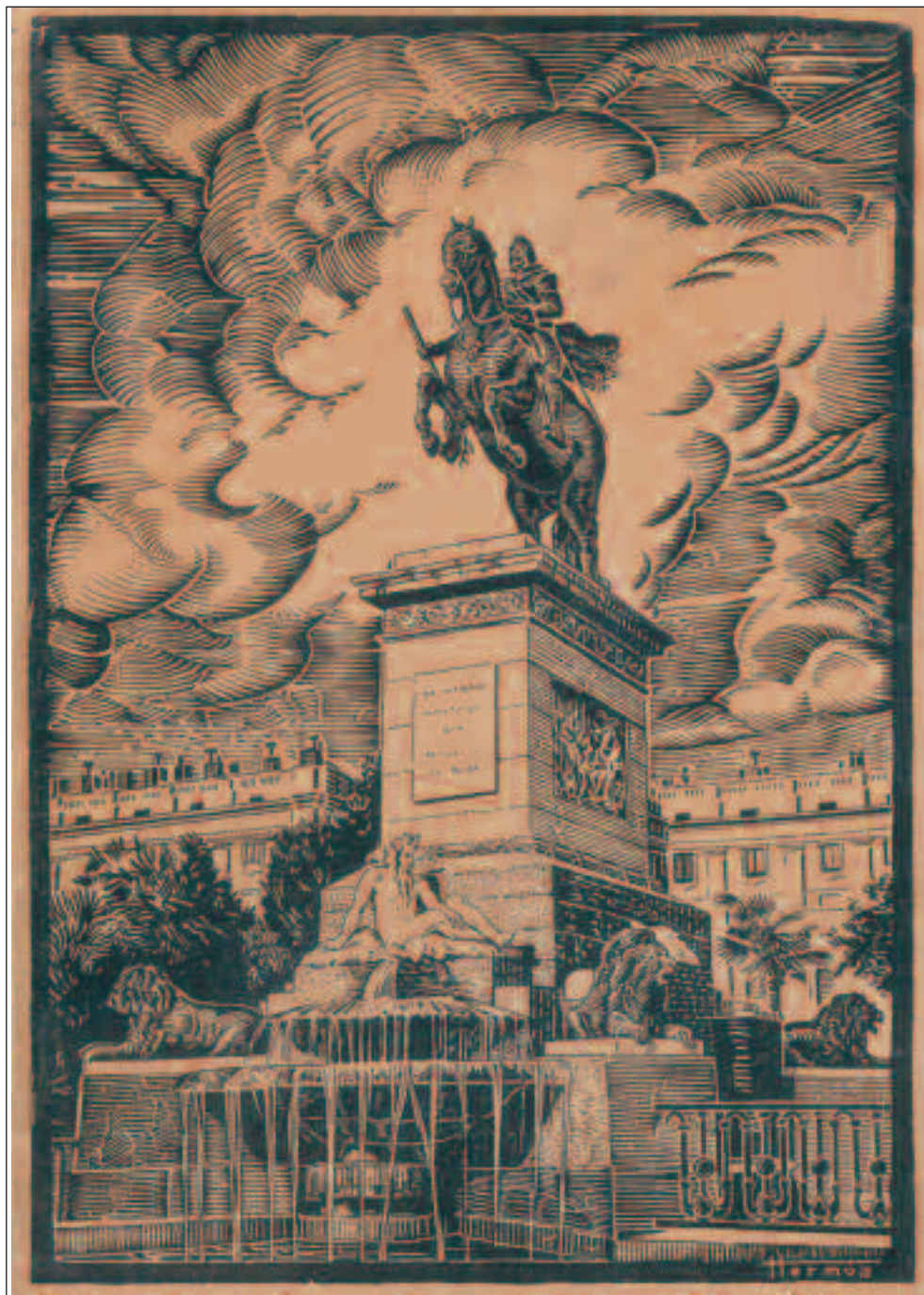
Ilustración de la portada, con la estatua ecuestre de Felipe IV.

El otro complemento del plano es la carpeta, que cuenta con una portada que representa la estatua ecuestre del rey Felipe IV en la plaza de Oriente, debida al dibujante Hermua , y una pequeña guía turística. Organizada en párrafos, describe en apretada síntesis la historia de la ciudad de Madrid y, como no podía ser menos, un conjunto de textos alusivos a los monumentos más importantes. Así se enumeran, entre otros, el Palacio Real, rebautizado como