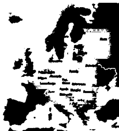
Fig. 1: Territorio continental de los Estados miembros de la Unión Europea.

Si se introduce la variable tiempo en estructurales provisionales, como por ejemplo en un andamio, un apeo o un apuntalamiento con una vida útil \leq 10 años (tabla 1), parece evidente que puedan utilizarse valores distintos en las acciones de los utilizados para un edificio normal con vida útil estándar de 50 años o para un edificio monumental con 100 años de vida útil.