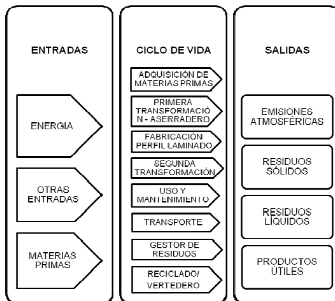
Figura1: Desarrollo del Análisis del ciclo de vida de la ventana de madera objeto de estudio.