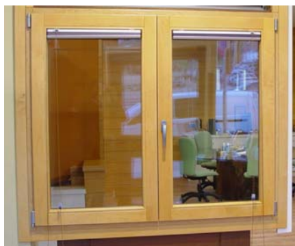
Figura 2: Imagen de la Unidad funcional (Elaboración propia).

Para la elección de la ventana modelo se realizó una estadística con datos de ventas de 2009 entre algunos fabricantes y se seleccionó una de las más vendidas. La ventana objeto de estudio tiene unas dimensiones de 1,2 m de ancho y 1,2 m de alto y un perfil laminado de pino silvestre de 68 mm de espesor. Los cristales son dos vidrios de 4mm de espesor cada uno con una cámara de aire intermedia de 12 mm. Los perfiles de la ventana pesan 20,33 Kg y el vidrio pesa 27,17 Kg. La ventana tiene de herrajes cuatro pernos, una maneta y una falleba que pesan en conjunto 1.5 Kg. Todos los datos necesarios han sido cedidos por la Asociación Española de Fabricantes de Ventanas de Madera; ASOMA.