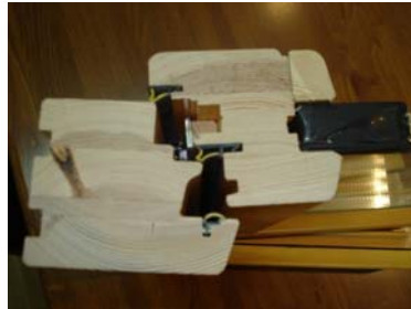
Figura 3: Imagen del perfil de la ventana (Elaboración propia).

Cerco: superficie de perfil = 4.077 \text{ mm}^2