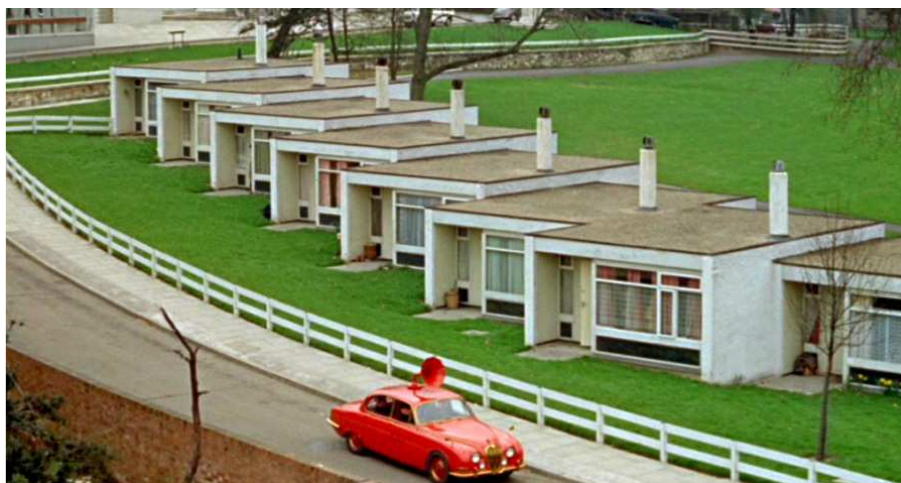
Figura 5. Aproximación a la casa del protagonista. Escena extraída de la película Fahrenheit 451 , de Truffaut (1966).

Empezaba a vivirse el auge de la televisión en los hogares. La relación ambivalente de este electrodoméstico en las zonas residenciales fue criticado desde aquellos sectores más intelectuales que alertaban de la tiranía del poder a través de los medios. Es el caso de las versiones cinematográficas de Fahrenheit 451 (Truffaut, dir., 1966) o la posterior 1984 (Radford, dir., 1984), que ponían de manifiesto ese clima alienante que se le presumía al modelo.