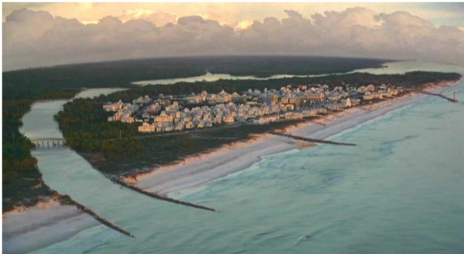
Figura 10. Imagen de Seaside extraída de la película El Show de Truman , del director australiano Peter Weir (1998).

El origen de Seaside se remonta a 1979 cuando su promotor, Robert S. Davis, heredó los cerca de 100 acres de terreno situados en una isla frente al océano. No queriendo crear otra comunidad dependiente del automóvil, Davis y su mujer contactaron con la pareja de urbanistas Duany y Plater-Zyberk para analizar las condiciones que más interesaban al ciudadano a la hora de asentarse en un territorio. El resultado fue este pueblo que se construyó en tan solo tres años.