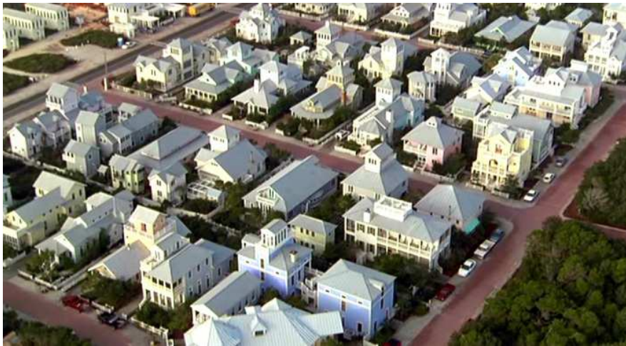
Figura 11. Vista aérea de Seaside extraída de la película El Show de Truman , del director australiano Peter Weir (1998).

En la isla de Seaheven, no existe objeto de comparación. A toda costa, el protagonista desea escapar de una vida en la que todo es aburrida felicidad y siniestra belleza, en la que la gente que le rodea desprende un sospechoso tufillo a anuncio publicitario. En clave de tragicomedia, el Show de Truman no sólo vende productos por televisión, también vende un estilo de vida.