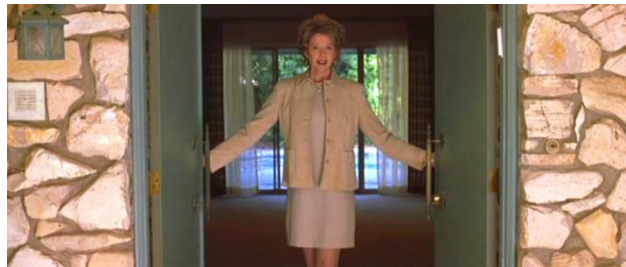
Figura 8. Protagonista abriendo la puerta de la vivienda. Escena extraída de la película American Beauty , de Sam Mendes (1999).

Esta insatisfacción provocada por el escenario suburbial es percibida con mayor intensidad por las mujeres, cuya aspiración de una vida mejor las redujo a meras consumidoras, es decir, a proveedoras de bienes para su hogar. Este tipo de asentamientos prometían un hogar singular, que aportaba privacidad y en el que primaban ciertos valores ambientales. La realidad ha revelado que se trata de asentamientos manifiestamente uniformes, que aíslan a sus habitantes y que son lesivos para el medio ambiente.