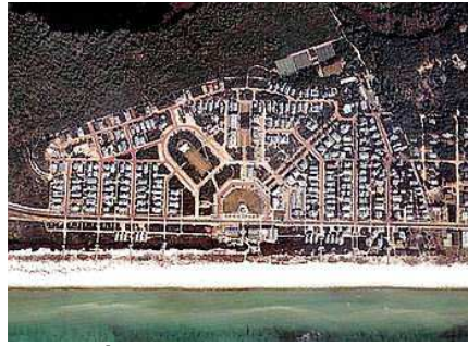
Figura 9. Vista aérea del planeamiento de Seaside.