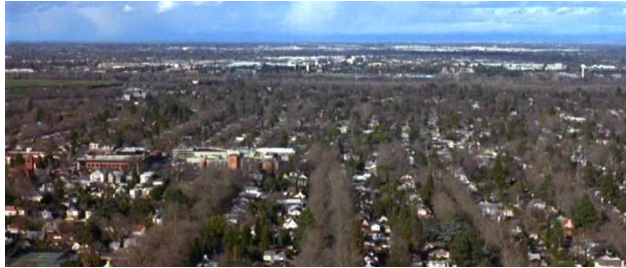
Figura 7. Vista aérea sobre el suburbio residencial. Escena extraída de la película American Beauty , de Sam Mendes (1999).

uniformidad en la vida de sus habitantes. Una uniformidad que al contrario de las propuestas más catastrofistas del tipo Fahrenheit 451 o 1984 , que hablaban de sociedades opresoras basadas en relatos de ficción, se ambienta en un entorno real –en este caso el suburbio– que fue construido con vocación de prosperidad e independencia y que, sin embargo, se ha revelado como asfixiante.