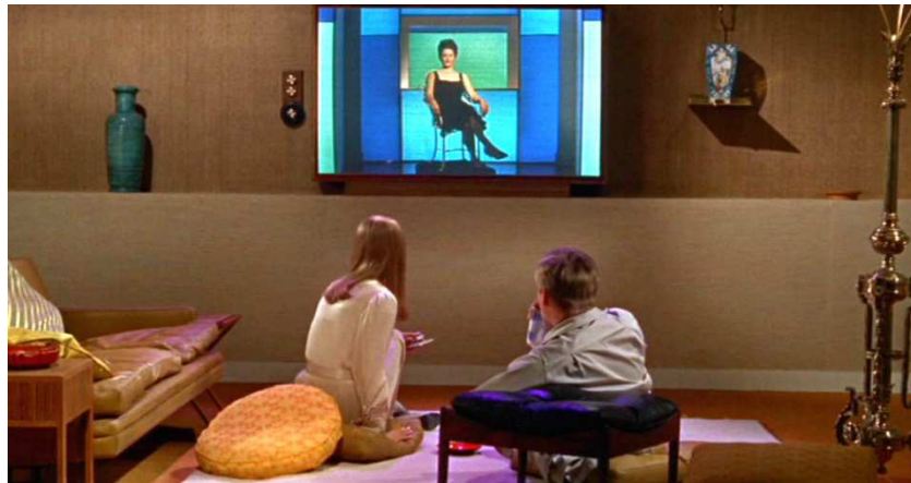
Figura 6. Interior de la casa del protagonista. Escena extraída de la película Fahrenheit 451 , de Truffaut (1966).

Según Debord, la evolución de esta sociedad modernizada hasta alcanzar el estadio de "espectacular integrado", responde al efecto combinado de cinco rasgos principales: la innovación tecnológica, inherente a la sociedad capitalista pero acelerada a partir del final de la Segunda Guerra Mundial de forma incesante; la fusión de la economía y el estado; el secreto generalizado; la falsedad sin respuesta, y un presente perpetuo (Debord 1988: 23). De esta manera, Debord establece las pautas de la contradicción que se plantea en toda sociedad espectacular al tratar de avanzar sobreviviendo a la resaca tecnológica y sin necesidad de prescindir de ella.