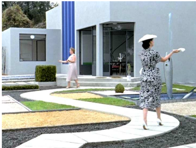
Figura 3. Escena extraída de Mon Oncle (1958) de Jacques Tati.

Mientras el cine americano publicitaba el modelo sin el más mínimo atisbo de autocrítica, en Europa Jaques Tati se anticipa en un año a la irrupción de la Nouvelle Vague . En 1958 rueda Mon Oncle ( Mi tío ), película en la que toma la vivienda como tema central, en consonancia con la preocupación de los tiempos de posguerra.