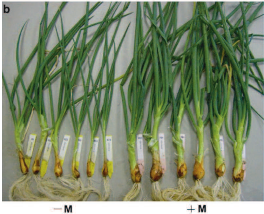
Dos ejemplos de genotipos de cebolla con distinta respuesta a la inoculación de micorrizas ( G. intraradices ). Los tratamientos son sin (-M) y con (+M) inoculación de micorriza. En (a) el genotipo es incapaz de crecer en un ambiente limitante en P sin micorrizas, mientras que (b) muestra un genotipo menos dependiente de la micorrización. Foto cedida por Thomas W. Kuiper, publicada en Galván et al., 2011.