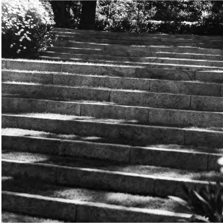
Jardín en la calle Serrano, Madrid.