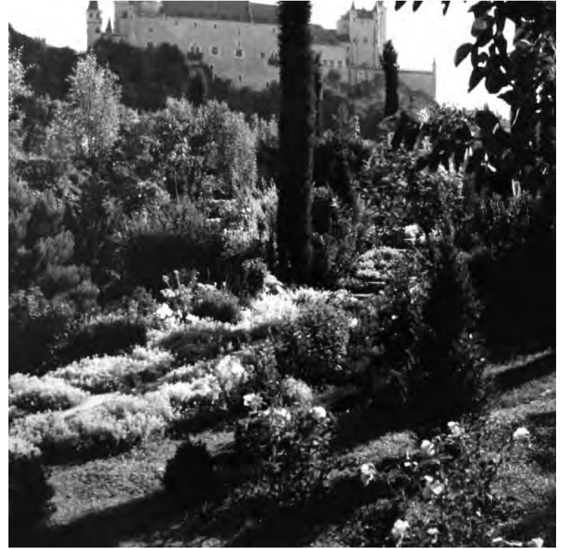
Romeral de San Marcos, Segovia. Legado Silva