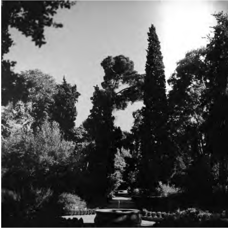
Restauración del Real Jardín Botánico, Madrid. Legado Silva