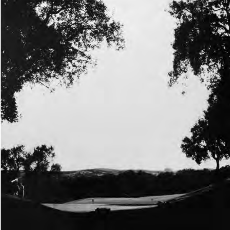
Restauración y Ampliación del Club de Golf Valderrama, Cádiz. Legado Silva