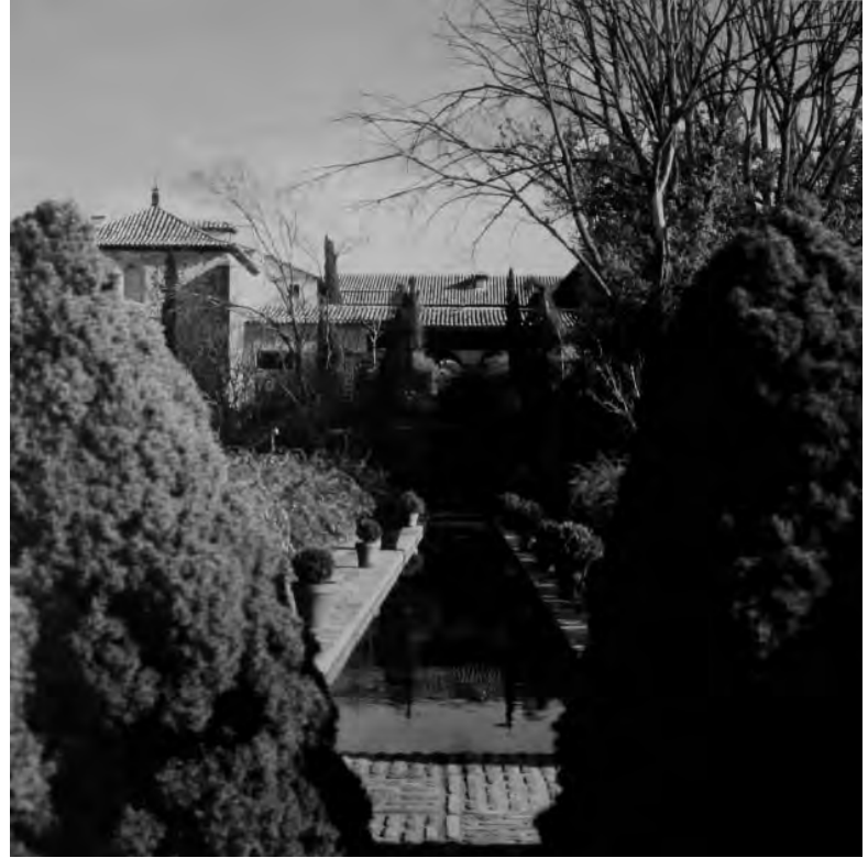
Jardines de la finca Santa María de las Nieves, Toledo.