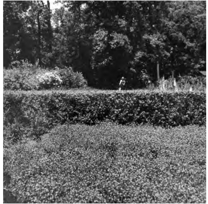
Parc des Floralies, Bois de Vincennes, París. Legado Silva