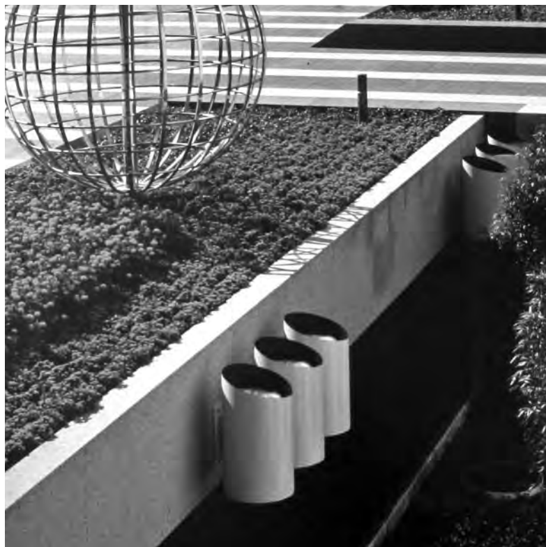
Jardines de Torre Picasso, Madrid. Legado Silva