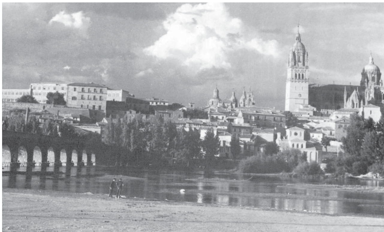
Las dos catedrales de Salamanca, ciudad natal de Antonio Fernández Alba.

Antonio Fernández Alba es uno de los arquitectos españoles más destacados de la segunda mitad del siglo XX. Son numerosas sus obras de arquitectura actual, con las cuales ha ganado un merecido prestigio internacional.