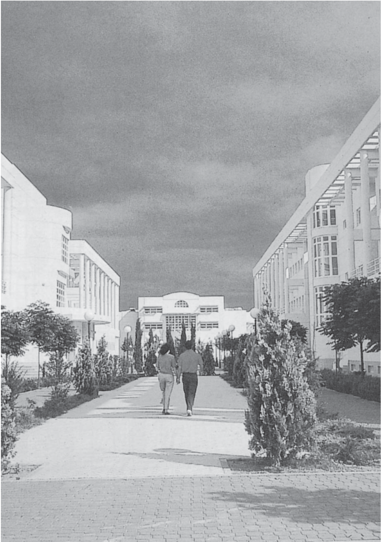
Universidad de Castilla - La Mancha Campus de Ciudad Real - Vista Parcial