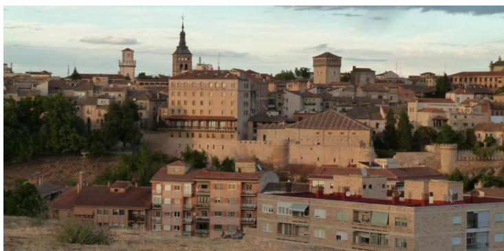
Fig. 8. Panorámica de la ciudad de Segovia desde los Altos de la Piedad.

mos para poder comparar y analizar la silueta de la ciudad, en la actualidad todavía se perfila una silueta de las torres de construcción medieval que han marcado la silueta de la ciudad, la muralla delimita la ciudad alta.