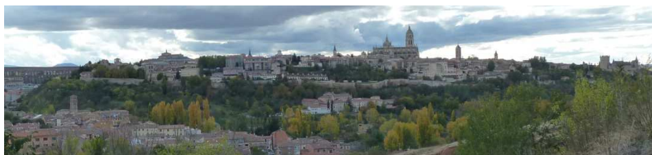
Fig. 3. Fotografía de la ladera norte de la ciudad de Segovia.

Observando la fotografía de la ciudad de Segovia destacan los elementos que configuran su silueta urbana. Una parte del aspecto actual de la ciudad alta, viene heredada de la ciudad medieval, las parroquias, viviendas populares, residencias de nobles, casas torre para la defensa de la ciudad, la muralla y el Alcázar. Hay tres construcciones que destacan por su mayor significación topográfica, simbólica y arquitectónica, que son: El Acueducto romano, como construcción perteneciente a la antigüedad que cruzando la vaguada abasteció de agua a la ciudad situada en la parte alta; en el extremo contrario se encuentra El Alcázar, como fortaleza en distintos momentos de la historia, situado en una cota topográfica inferior cercano a la confluencia entre los ríos Eresma y Clamores; y la Catedral nueva situada en la zona topográfica más elevada de la ciudad que destaca por su volumen del resto de las edificaciones, construida a partir del siglo XVI.