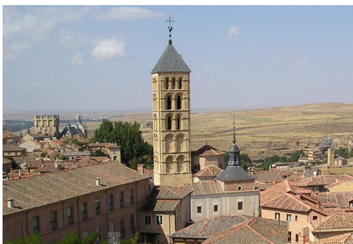
Fig. 5. Fotografía realizada desde la Torreón de Hércules

Desde las ventanas de la Torre de la casa de los Cascales-Barros situada en la plaza platero Oquendo se tiene una visual cruzada con el torreón de Lozoya, que da un valor de vigilancia mutua entre las arquitecturas nobiliarias de la ciudad.