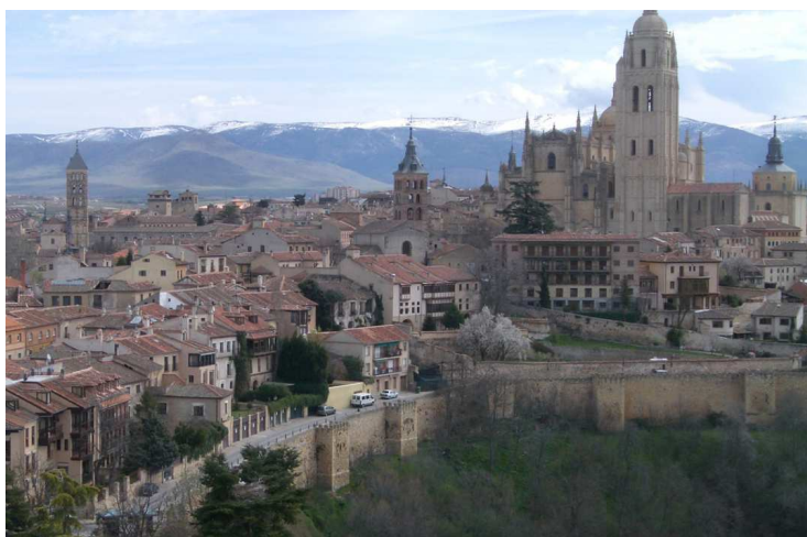
Fig. 9. Panorámica de la ciudad de Segovia desde la torre del Alcázar.

Actualmente desde los Altos de la Piedad, se comprueba que la silueta de los torreones se ha mantenido, aunque algunos grandes edificios como el hotel sirenas y el edificio del Seminario se han apoderado de parte de la silueta. La muralla aparece delimitando la parte baja del recinto de la ciudad alta, siguiendo un trazado según la topografía de la ladera sur. Los dos torres del Lozoya se reconocen en las dos fotografías y a un nivel inferior se descubre también la torre de la muralla junto a la Casa de los Picos, incluso se encuentra en la parte inferior en el extremo derecho el Acueducto.