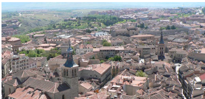
Fig. 4. Fotografía realizada desde lo alto de la catedral

miran hacia el sur descubrimos el Torreón de los Arias Dávila, rivalizando en altura y desafío constructivo.