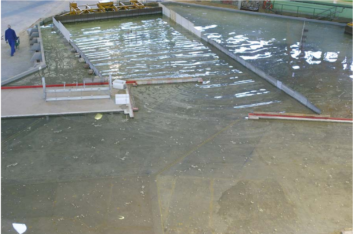
Fotografía 4. Vista general del modelo físico. Fase 2, Alternativa 3.

Las tres alternativas, se analizaron bajo la acción de los oleajes más influyentes en la zona. Se realizaron ensayos adicionales, con el oleaje del sector direccional E+ENE y dos periodos de pico, T_p = 9 y 11 s con varias longitudes de prolongación del Dique Este de valores intermedios entre los arriba indicados. Estos ensayos adicionales tenían por objeto analizar la influencia de la prolongación progresiva del Dique Este en el grado de agitación en la zona donde se realizaron los ensayos de buques atracados, una vez que los resultados obtenidos en estos últimos, aparentemente contradictorios (resultados con el dique de 229 m peores que sin la prolongación del Dique Este), crearon cierta incertidumbre.