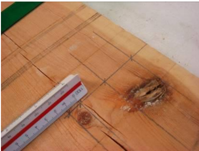
Fig. 1. Medición de un nudo en el proceso de clasificación visual.

En este apartado se presenta el procedimiento seguido para la realización del trabajo experimental.