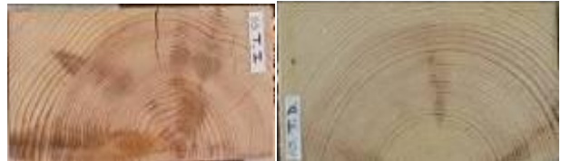
Fig. 2. Detalle de las caras un la vigas 10 ensayada en posición plana.

vez medidos dichos aspectos se estudia la relación entre éstos y las propiedades mecánicas obtenidas en los ensayos. Los defectos que se van a analizar, y que contempla la norma para