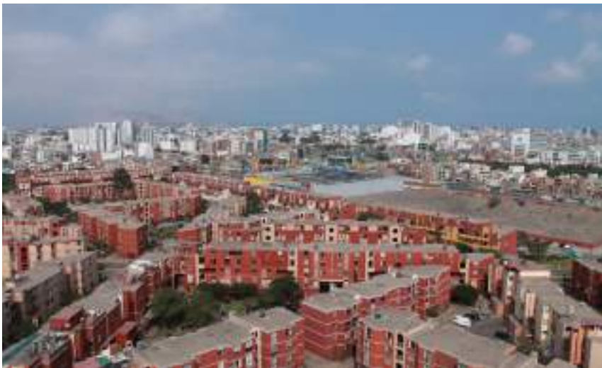
Figura 1. Limatambo