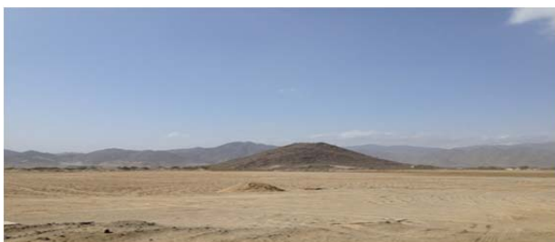
Figura 1: Emplazamiento de Khatm al Melaha.

evidencia en un impresionante número de petroglifos hallados en la zona.