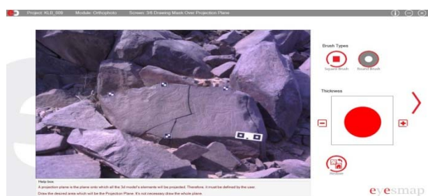
Figura 2: Interfaz de la Tablet EyesMap.

El equipo EyesMap cuenta con un procesador Intel Core i7, de 16 gigas de RAM, y funciona sobre el sistema operativo Windows 8, fácil de usar una vez nos familiarizamos con su manejo (Fig. 2).