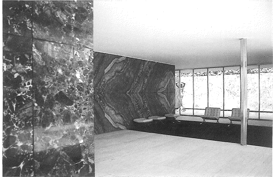
Pabellón de Barcelona, reconstruido (Mies van der Rohe, 1929).

El dilema de Mies como autor, estable y variable en el tiempo, estriba justamente en la dificultad de patentizar lo latente de forma sutil y variable. Ese trabajo de "composición" no es otra cosa que la lucha por controlar la necesidad y el azar, mediante el rigor y la coherencia. La tensión entre el autor y su obra oscila entre la fidelidad a los propios recuerdos y la búsqueda apasionada de su posteridad. Con esta consideración podemos abordar algo que condiciona el trabajo del arquitecto: el rastro que su obra dejará en la historia. A partir de esa preocupación debe entenderse el afán de muchos autores por interpretar su papel histórico de forma convincente y por dejar las pistas precisas para que su personaje se reconstruya según su propio interés. La interpretación de la propia obra desempeña en este sentido un papel fundamental. A este respecto, Mies parece un espectador inmutable de los hechos históricos, a los que da la importancia de lo anecdótico porque quizás aspira a escribir otra Historia. Mies es su propia referencia, utilizando el tiempo a favor de su misma recreación. Su tiempo vital, en cierto modo proustiano, se constituye por su propia permanencia, en una referencia válida para los demás por su misma fijeza. Representa así el tiempo de los demás mejor que cualquier otro. El papel histórico de Mies, sin pretenderlo explícitamente, es el de protagonista de su tiempo.