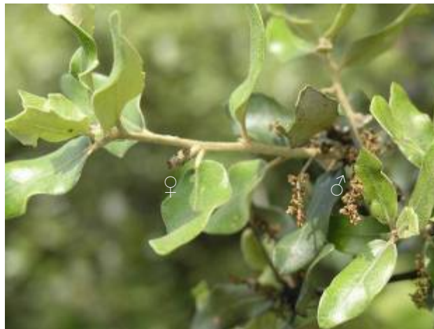
Imagen 1. Detalle de la floración en la encina ( Quercus ilex ).

El género Quercus pertenece a la familia de las Fagáceas del orden de las Fagales. Las flores son monoicas (Imagen 1), presentan las flores masculinas en amentos colgantes, las flores femeninas separadas de las masculinas, aunque sobre el mismo árbol, y fruto en bellota sólo parcialmente recubierta por la cúpula (Montoya Oliver, 1993).