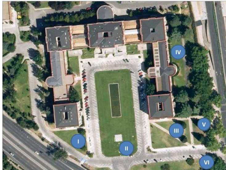
Figura 1. Distribución de las parcelas de muestreo en la ETSIA de Madrid.

Ciudad Universitaria: Echium asperrimum Lam., Oxalis articulata Savigny, Chelidonium majus L., Paspalum paspalodes (Michx.) Scribn. y Viola odorata L.