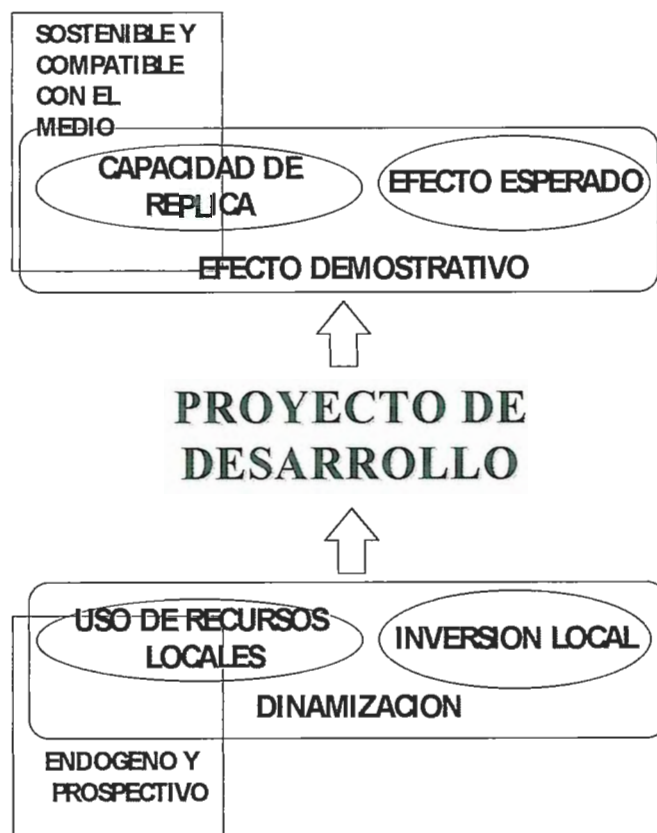
Figura 1: Características del desarrollo de abajo-arriba

Los resultados obtenidos en el período comprendido entre el 1991 y el 1994 fueron positivos en casi todas las zonas rurales europeas donde se implantó. La inversión total pública y privada en el LEADER I alcanzó los 1.155 Mecus. y desarrolló un total de 217 programas, de los cuales 52 correspondieron a comarcas españolas. Por lo cual, se optó por la continuidad del programa creando la iniciativa LEADER II el 15 de Junio de 1994.