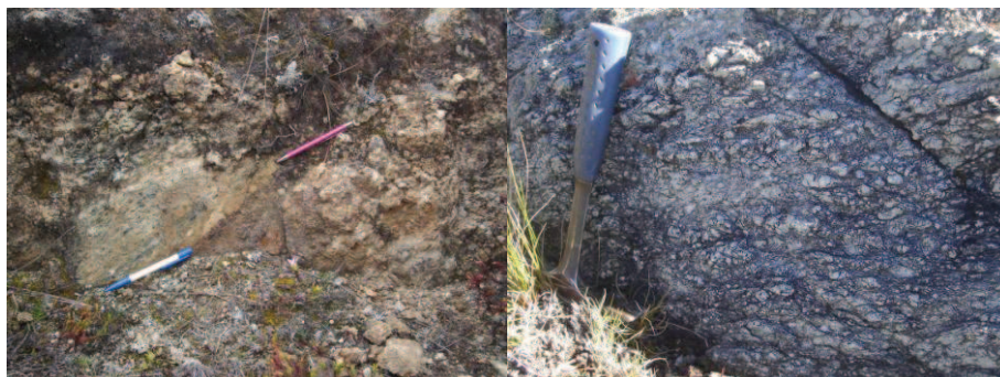
Figura 2. Superposición de serpentinitas del Macizo de Tapo sobre areniscas del Grupo Ambo. Nótese la intensa cataclasis de ambas rocas (foto de la izquierda). Milonitas de metagabro en el contacto con las filitas del Grupo Huácar, cuerpos ultramáficos de Acobamba (fotografía de la derecha).

En estos dos pequeños cuerpos de ultramafitas, la deformación interna es polifásica e idéntica en todo al cuerpo ultramáfico-máfico de Tapo. Se distingue una foliación principal (Sn), penetrativa, de origen no-coaxial, como se puede comprobar por la abundancia de varios indicadores cinemáticos típicos de este tipo de deformación (sistemas de porfiroclastos, estructuras C/S). La presencia de planos S cizallados indica la existencia de un episodio anterior que generó una foliación, también penetrativa, referida como Sn-1. Se observa una intensa filonitización en las filitas del contacto con las serpentinitas, la cual tiende a desaparecer cuando aumenta la distancia al contacto. Las rocas ultramáficas también están milonitizadas. Las lineaciones poco usuales observadas tienen orientaciones que siguen la dirección del plano que las contiene. Los gradientes espaciales de la fábrica ocurren también en los metagabros de Tapo, donde se observa un paso gradual de metagabros foliados a metagabros milonitizados (Figura 2). Esta asociación de mesoestructuras, que evidencian una deformación fuertemente no-coaxial y gradientes espaciales de la fábrica, permite interpretar la existencia de accidentes de cizalla. El accidente que divide longitudinalmente el cuerpo de Tapo, o los accidentes basales de los pequeños cuerpos de serpentinita de Acobamba son también ejemplos de ello.